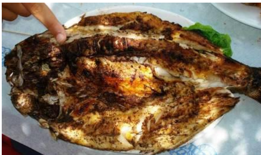
Εικόνα 11 χέλια πετάλια