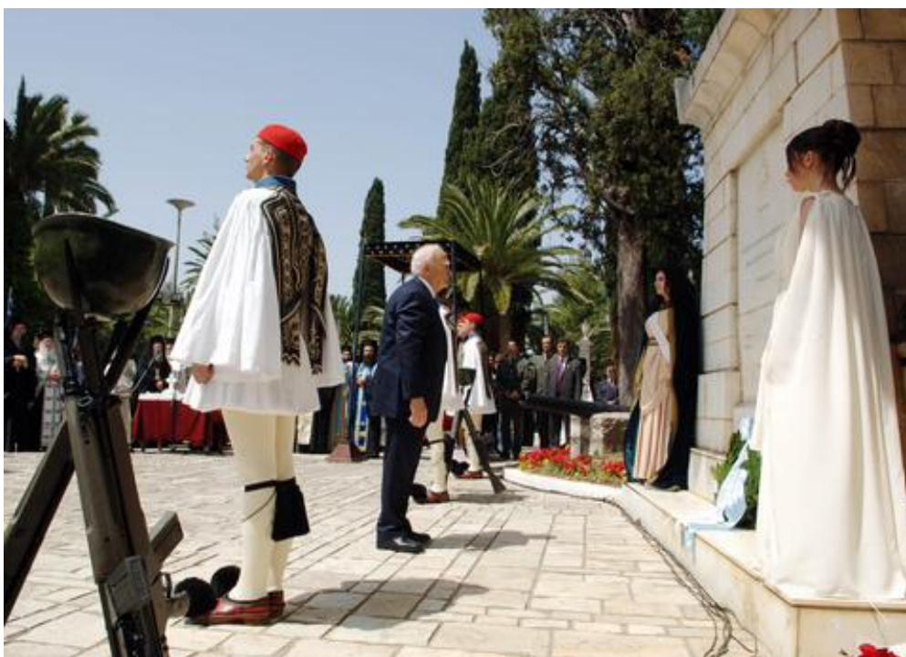
ΕΙΚΟΝΑ 8. Ο Πρόεδρος της Δημοκρατίας Κάρολος Παπούλιας στον εορτασμό προς τιμή των πεσόντων της Εξόδου. 21 Απριλίου 2008

Για την οργάνωση και την διεξαγωγή της παραπάνω εκδήλωσης κάθε χρόνο συνεργάζονται όλοι οι τοπικοί Σύλλογοι του Μεσολογγίου, ο Δήμος και η Νομαρχία οι οποίοι φορείς προσκαλούν πολιτιστικούς συλλόγους ανά την Ελλάδα με σκοπό να παρουσιαστούν με τις τοπικές ενδυμασίες και να τιμήσουν τους Ήρωες του 1821.