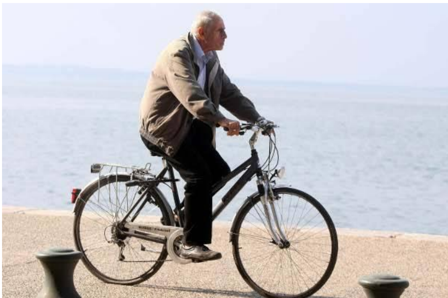
ΕΙΚΟΝΑ 9 Ποδηλατικός τουρισμός