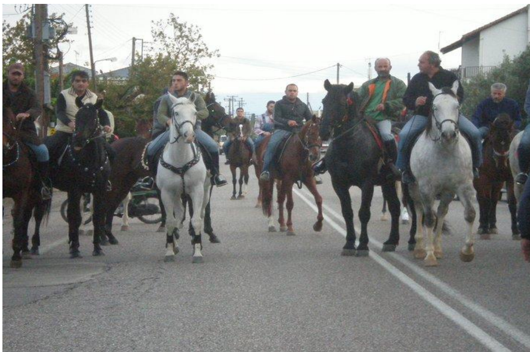
ΕΙΚΟΝΑ 7 Παρέα καβαλάρηδων από το πανηγύρι του Αγίου Συμεών

Ακόμα ένα πολιτιστικό δρώμενο - πανηγύρι είναι αυτό του Αγίου Συμεών. Είναι ένα δρώμενο, το οποίο διοργανώνεται από το Δήμο Μεσολογγίου και τον σύλλογο Αή – Σημιωτών. Διαρκεί 3 ημέρες και περιλαμβάνει καβαλάρηδες ( εικόνα 7 ) και αρματωμένους με συνοδεία παραδοσιακών