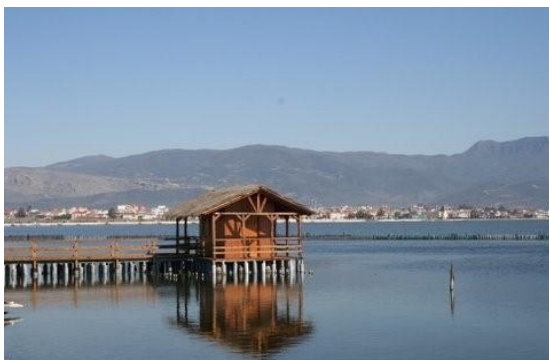
ΕΙΚΟΝΑ 2: Μεσολόγγι. Η λιμνοθάλασσα

Το Μεσολόγγι είναι πρωτεύουσα του Νομού Αιτωλοακαρνανίας και βρίσκεται στο νότιο τμήμα του. Καταλαμβάνει μία έκταση 151,889 km 2 και απέχει περίπου 35 και 37 χιλιόμετρα από το Αγρίνιο και το Αντίρριο αντίστοιχα. Το Μεσολόγγι βρίσκεται μεταξύ των ποταμών Αχελώου και Ευήνου και κατά την απογραφή του 2001 είχε 18.121 κατοίκους, οι οποίοι μαζί με τις πρώην γειτονικές κοινότητες, που ενσωματώθηκαν στον σημερινό καποδιστριακό δήμο, αποτελούν ένα δυναμικό οικιστικό σύνολο. (Μακρής Νικόλαος Δ. 1829-1911)