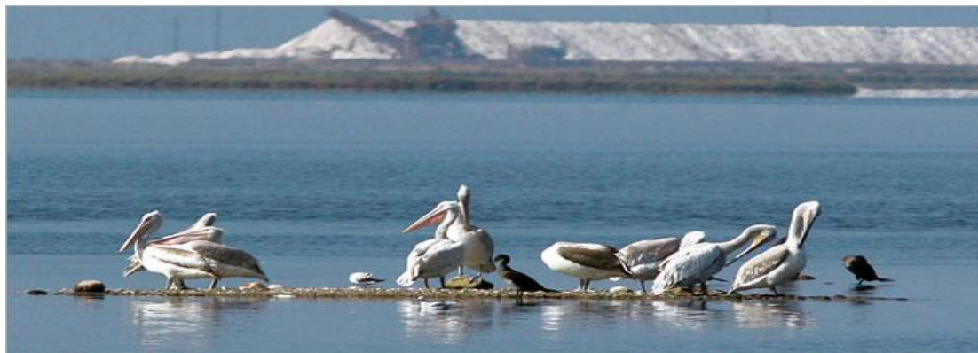
ΕΙΚΟΝΑ 5 Προστατευόμενα πτηνά με θέα τις αλκές

λουρονησίδες και αλμυρολίβαδα. Ο υδρότοπος Μεσολογγίου – Αιτωλικού είναι κυκλωμένος και από βουνά: τον Αράκυνθο, τα Πετρωτά, τον Κουτσιλάρι και την Βαράσοβα. Αυτοί οι ορεινοί όγκοι συμβάλλουν καθοριστικά όχι μόνο στο εντυπωσιακό τοπίο, αλλά και στην ποικιλότητα των οικοσυστημάτων.