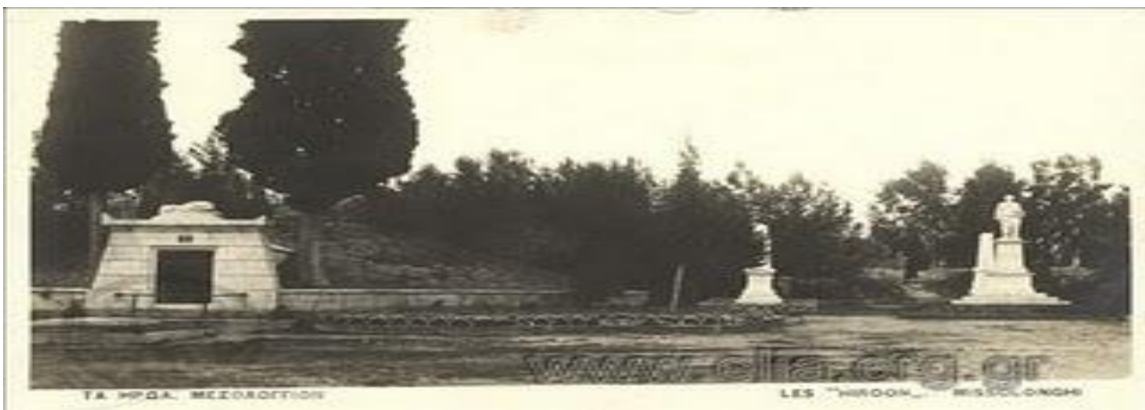
Εικόνα 3 -ο κήπος των Ηρώων.

Τα τείχη και η πύλη της Ιερής Πόλης του Μεσολογγίου παραμένουν μέχρι και σήμερα επιβλητικά και όποιος βρεθεί εκεί μπορεί να επισκεφτεί των Κήπο των Ηρώων, όπου έχουν θαφτεί πολλοί γνωστοί ήρωες, που πολέμησαν κατά την ηρωική Έξοδο ( εικόνα3 ).