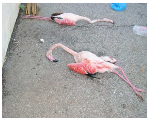
ΕΙΚΟΝΑ 15 Νεκρά φλαμίνγκος από τη μόλυνση του περιβάλλοντος