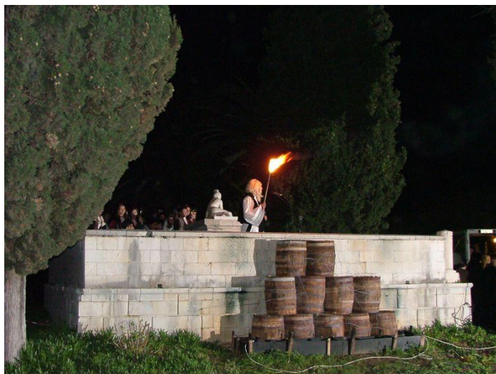
ΕΙΚΟΝΑ 13 Παραδοσιακά τοπικά έθιμα

Επιπλέον, η Ελλάδα έχει πολλά ήθη και έθιμα που διαφέρουν από περιοχή σε περιοχή και που μερικές φορές προσφέρουν θέαμα. Τέτοια είναι η αναπαράσταση της ανατίναξης της τούρκικης ναυαρχίδας από τον Κανάρη στην Ύδρα, η Αρμάτα στις Σπέτσες, το σπάσιμο σταμνών το Μεγάλο Σάββατο στην Κέρκυρα, η αναπαράσταση ανατίναξης της Εξόδου του Μεσολογγίου από τον Καψάλη ( εικόνα 13 ), αποκριάτικα δρώμενα και ακόμα οι παραδοσιακοί γάμοι που λαμβάνουν χώρα σε διάφορα μέρη της χώρας, για παράδειγμα στο Μεσολόγγι, μέρες πριν το γάμο οι ανύπαντρες στρώνουν τα σεντόνια στην κρεβατοκάμαρα του μελλοντικού αντρόγунου και αφού στρωθεί βάζουν σε δημόσια θέα τα λεγόμενα «προικιά» ώστε να καμαρώσουν όλοι οι φίλοι και οι συγγενείς την προίκα της νύφης. Μετά την επόμενη μέρα, πραγματοποιείται γλέντι στο σπίτι του γαμπρού στο οποίο οι άντρες ψήνουν αρνιά και οι γυναίκες ετοιμάζουν το γλυκό του γάμου τους κουραμπιέδες τους οποίους οι ίδιες έχουν φτιάξει.