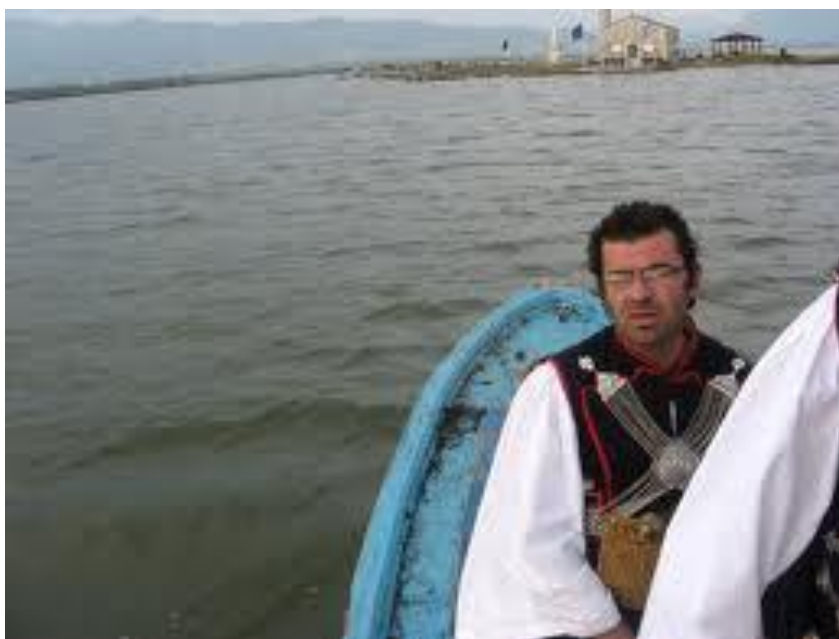
ΕΙΚΟΝΑ 10 Απεικόνιση με παραδοσιακές φορεσιές

Το Μεσολόγγι έχει πολλά εκκλησάκια. Το πιο σημαντικό είναι το έθιμο του Αγίου Δημητρίου, όπου ομάδες καβαλάρηδων ιπεύουν στην εκκλησία του Αγίου Δημητρίου για να πάρουν την ευλογία του Αγίου. Όπως επίσης σημαντικό είναι το μοναστήρι του Αγίου Συμεών (Αη Σημιός που αναφέρθηκε παραπάνω) στο οποίο του Αγίου Πνεύματος οι καβαλάρηδες διανυκτερεύουν στο μοναστήρι πίνοντας και χορεύοντας.