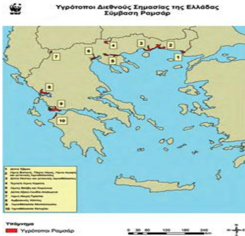
ΕΙΚΟΝΑ 1: Χάρτης υγροτόπων Διεθνούς σημασίας της Ελλάδας, Σύμβαση Ραμσάρ.

Στην τελευταία συνάντηση της Διαρκούς Επιτροπής της Συνθήκης Ramsar, τον Μάιο 1999, η ελληνική αντιπροσωπεία δήλωσε, ότι θα μελετήσει, επίσης, την ένταξη στον κατάλογο Ramsar, το ελληνικό τμήμα της Μεγάλης Πρέσπας και την Αλυκή Κίτρους. Τέλος, αξίζει να σημειωθεί, ότι εκτός από το Δέλτα του Έβρου, την λίμνη Κερκίνη και την λίμνη Μικρή Πρέσπα, οι υπόλοιποι προαναφερθέντες υγρότοποι περιλαμβάνονται στο πρωτόκολλο Montreux, δηλαδή στον κατάλογο των υγροτόπων, οι οποίοι έχουν υποβαθμιστεί ή απειλούνται σημαντικά λόγω των ανθρώπινων επεμβάσεων.