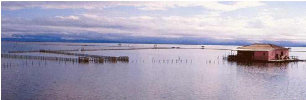
ΕΙΚΟΝΑ 4 Η λιμνοθάλασσα.

Η Λιμνοθάλασσα του Μεσολογγίου ( εικόνα 4 ) είναι ένα κομμάτι θάλασσας, που έγινε ξέβαθο από τις προσχώσεις του Αχελώου με μέγιστο βάθος τα 5 με 6 μέτρα. Ωστόσο, ακόμα το μεγαλύτερο μέρος της έχει βάθος το οποίο δεν ξεπερνά το μισό μέτρο, ενώ, αξίζει να αναφερθεί, ότι κοντά στις ακτές το βάθος φτάνει περίπου τους 10 πόντους. Αυτός άλλωστε είναι και ο λόγος που ο τόπος προσφέρεται για αλυκές. (Μακρής Νικόλαος Δ. 1829-1911)