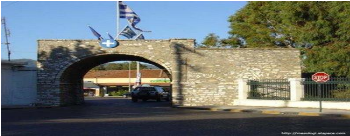
ΕΙΚΟΝΑ 3 Τα τείχη και η πύλη του Μεσολογγίου σήμερα.

από την πόλη ( εικόνα 1 ). Ήταν η νύχτα της 10 ης Απριλίου 1826, η οποία έμεινε γνωστή ως η «Έξοδος του Μεσολογγίου». Την περίοδο αυτή οι κάτοικοι της πόλης ήταν 10.500 εκ των οποίων μόνο οι 3.500 ήταν οπλισμένοι. Όπως ήταν επόμενο, λίγοι ήταν οι Μεσολογγίτες που επιβίωσαν κατά την Έξοδο. Για την ηρωική στάση των Μεσολογγιτών η πόλη δέχτηκε την τιμή να της αποδοθεί ο τίτλος της Ιερής Πόλης, η οποία είναι μοναδική στην Ελλάδα.