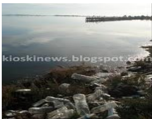
ΕΙΚΟΝΑ 14 Απεικόνιση από σκουπίδια σε παραλία

Στην περιοχή του Μεσολογγίου λειτουργούν camping, τα οποία απλώνονται μέσα στη φύση, και προτιμούνται γιατί εξασφαλίζουν πιο οικονομικές διακοπές. Οι τουρίστες εκεί ανάβουν φωτιές, επομένως υπάρχει πάντα ο κίνδυνος της φωτιάς . Χρησιμοποιούνται διάφορα πλαστικά αντικείμενα (π.χ. μπουκάλι νερού, πιατάκια, ποτηράκια κ.ά.) τα οποία αρκετές φορές πετιούνται οπουδήποτε αλλού, εκτός από τους κάδους των απορριμμάτων, έχοντας ως αποτέλεσμα την ρύπανση του περιβάλλοντος γιατί το πλαστικό δεν ανήκει στα ανακυκλώσιμα υλικά. Δυστυχώς ανά καιρούς τέτοιου είδους ρύπανση έχει παρατηρηθεί στην λιμνοθάλασσα με αποτέλεσμα των θάνατο των προστατευόμενων πτηνών κυρίως των φλαμίνγκο.