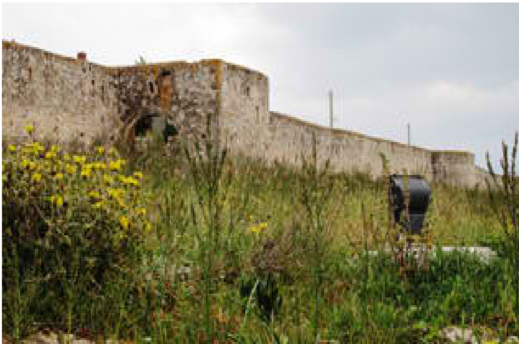
Τείχος Αγίας Τριάδας(Φωτογραφία 7 )

Στην περιοχή της χερσονήσου της Αγίας Τριάδας συναντάμε ένα μοναδικό στο είδος του οχυρωματικό έργο της επαναστατικής περιόδου. Τοποθετείται γεωγραφικά νοτιοανατολικά του τμήματος της ανάπλασης μας. Με βάση τις πηγές, Το ΤΕΙΧΟΣ ΤΗΣ ΑΓΙΑΣ ΤΡΙΑΔΑΣ, όπως είναι γνωστό, κατασκευάστηκε μεταξύ του 1818 και 1824 και χρησίμευσε για την οχύρωση της περιοχής κατά την επαναστατική περίοδο, στην οποία κατέφευγαν οι Μεγαρείς κατά τις εχθρικές επιθέσεις. Οι Μεγαρείς φρόντισαν να χτίσουν το τείχος γιατί είχαν σωστές πληροφορίες από την Φιλική Εταιρεία, που μέλη της ήταν πολλοί Μεγαρίτες. Είναι το μοναδικό οχυρωματικό έργο της χρονολογικής αυτής περιόδου που σώζεται σε όλο το μήκος του. Είναι σύγχρονο με τα ανάλογα οχυρωματικά έργα των Μεθάνων και των Δερβενακίων, με τη διαφορά ότι τα τελευταία βρίσκονται σε ερείπια. Η κεντρική πύλη του οχυρού βρίσκεται τοποθετημένη στη Μονή της Φανερωμένης στη Σαλαμίνα.