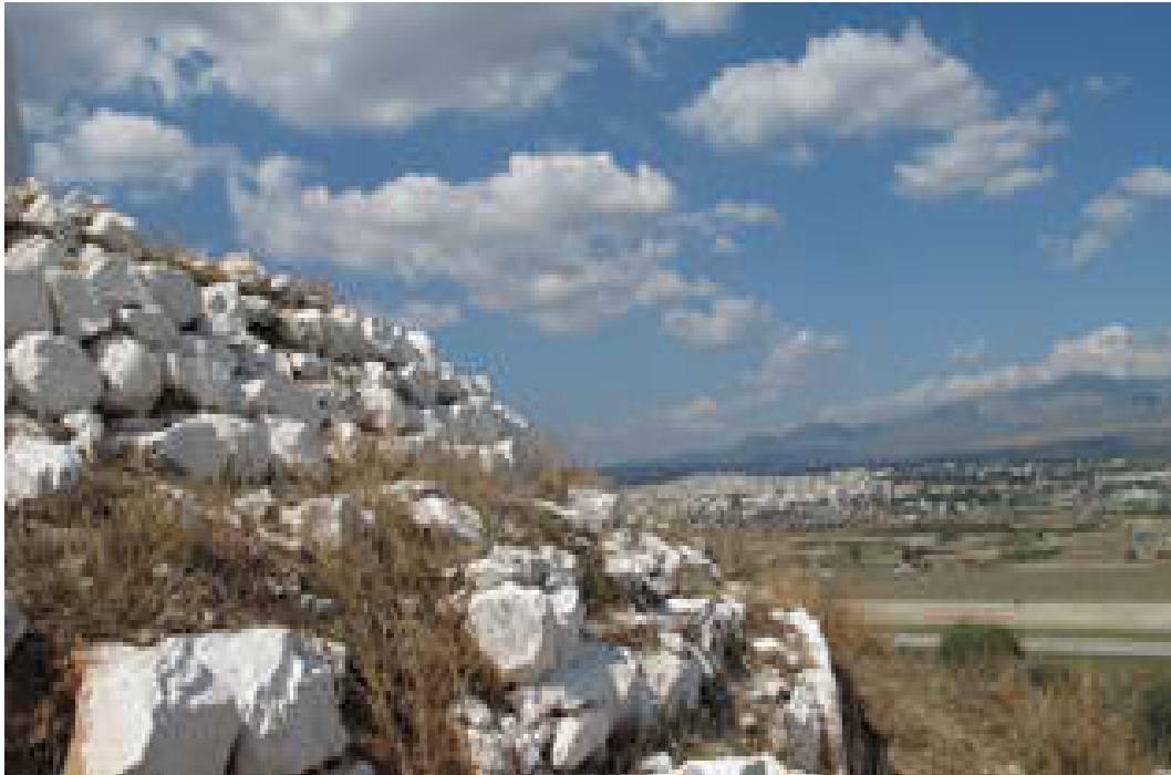
Λόφος Αγίου Γεωργίου (Φωτογραφία 4)

Ο λόφος του Αγίου Γεωργίου βρίσκεται απέναντι από το Παλαιόκαστρο στα ανατολικά με ύψος 90 μέτρων. Στην κορυφή σώζεται φρούριο της κλασικής εποχής που χρησίμευε ως ακρόπολη του λιμανιού της Νισαίας. Το λιμάνι αυτό ταυτίζεται με το έλος ανάμεσα στους δύο λόφους της Πάχης: το Παλαιόκαστρο και τον Άγιο Γεώργιο. Εκεί, σύμφωνα με το μύθο, προσάραξε ο βασιλιάς της Κρήτης Μίνωας όταν κατέλαβε τα Μέγαρα.