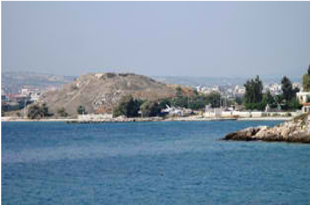
Το Παλαιόκαστρο (Φωτογραφία 6)

Ο Λόφος Παλαιόκαστρο στην παραλία των Μεγάρων βρίσκεται δυτικά από το τμήμα που σκοπεύουμε να αναπλάσουμε και παρουσιάζει ιδιαίτερο αρχαιολογικό ενδιαφέρον και χρονολογείται από το 3000 π.Χ. Η λέξη Φραγκονέρι έχει σχέση με το Δούκα των Αθηνών Φράγκο Νέριο που κατείχε το Παλαιόκαστρο και τη γύρω περιοχή στα χρόνια της Φραγκοκρατίας στην Ελλάδα (1204 μ.Χ. – 16ος αι.). Σύμφωνα με τις πηγές, είναι «Κωνικός λόφος ύψους 40 μέτρων στην παραλία των Μεγάρων. Μερικοί πιστεύουν ότι ο λόφος αυτός χρησίμευε ως ακρόπολη της αρχαίας Νισαίας που ήταν το λιμάνι των αρχαίων Μεγαρέων στο Σαρωνικό κόλπο. Στην κορυφή του λόφου σώζεται τμήμα οχύρωσης ύστερων μεσαιωνικών χρόνων. Μικρή ανασκαφική έρευνα που πραγματοποιήθηκε πριν τον πόλεμο απέδωσε και ευρήματα που χρονολογούνται και σε προϊστορικές περιόδους.