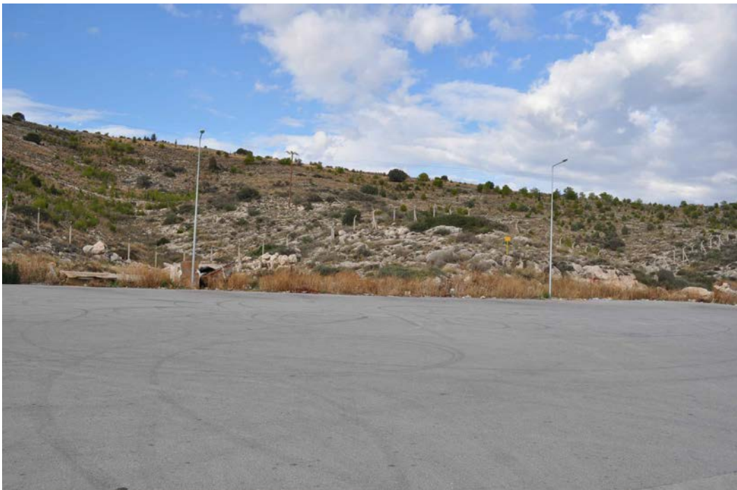
Δυτική άποψη τμήματος ανάπτυξης ( φωτογραφία 12 )