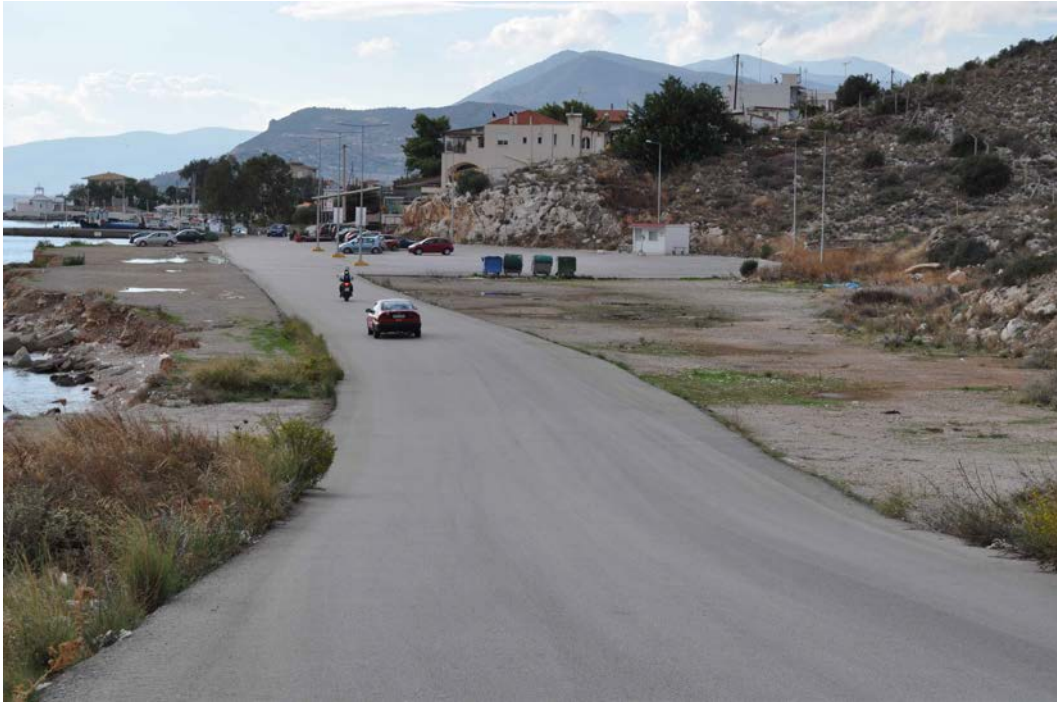
Ανατολική άποψη τμήματος ανάπτυξης ( φωτογραφία 13 )