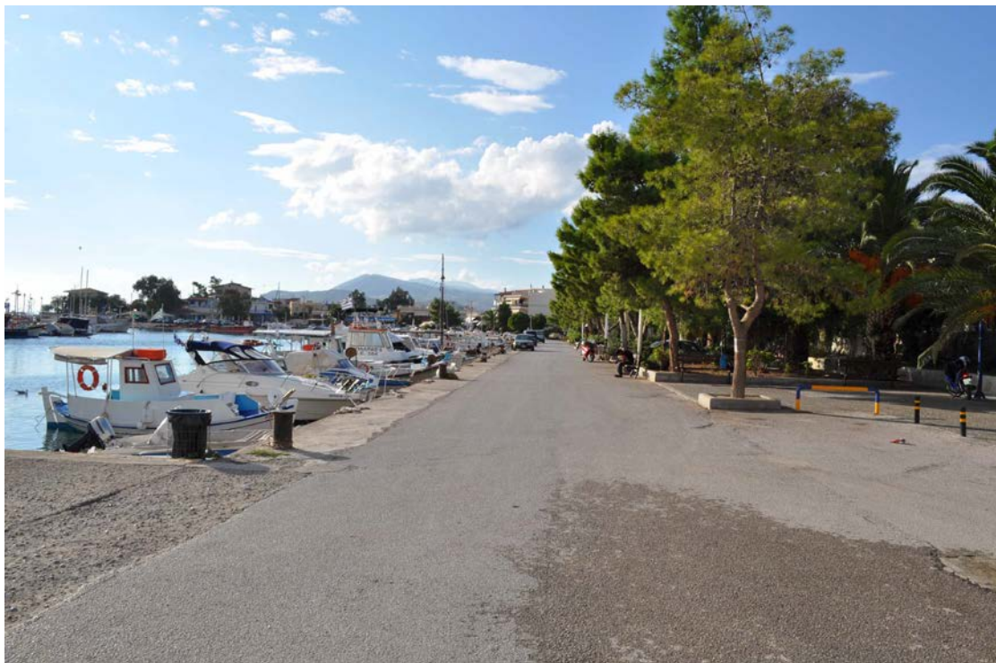
Λιμάνι Πάχης (Φωτογραφία 2)