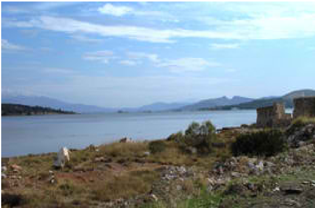
Ανατολική άποψη Βουρκαρίου (Φωτογραφία 9)

λιμνοθάλασσα με περιορισμένη επικοινωνία με τον Σαρωνικό κόλπο. Σύμφωνα με καταγραφές της Ορνιθολογικής Εταιρείας, παρουσιάζει μεγάλη ποικιλία σχετικά με τα είδη ορνιθοπανίδας που φιλοξενεί, ιδιαίτερα αν λάβουμε υπόψη και τη γεωγραφική του θέση. Εδώ απαντώνται 127 είδη πουλιών, πολλά από τα οποία χρησιμοποιούν τον υγρότοπο ως ενδιάμεσο σταθμό τροφοληψίας - ξεκούρασης κατά την μεταναστευτική περίοδο. Η σημασία διατήρησης του υγρότοπου επιβάλλει τον χαρακτηρισμό της περιοχής ως τέτοιου από την επίσημη πολιτεία, λόγω των πιέσεων που δέχεται από την αστικοποίηση και τις άλλες ανθρώπινες δραστηριότητες. Προς αυτή την κατεύθυνση δραστηριοποιούνται οι κοινωνικοί φορείς, οι εθελοντικές οργανώσεις και ο Δήμος Μεγαρέων. Ο υγρότοπος προσφέρεται ως πόλος περιβαλλοντικής εκπαίδευσης και ενημέρωσης για την ευρύτερη περιοχή.