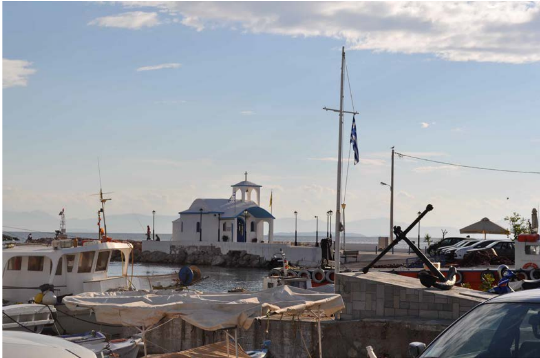
Λιμάνι Πάχης (Φωτογραφία 3)