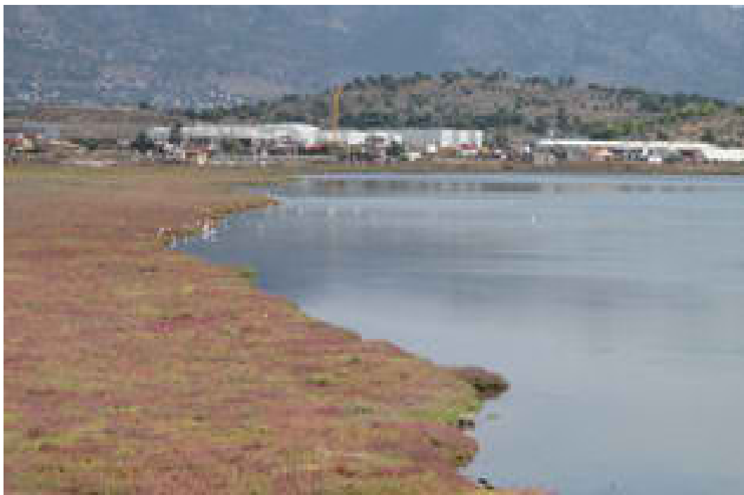
Βουρκάρι (Φωτογραφία 8)

Στα νοτιοανατολικά του οικισμού της Πάχης ξεχωρίζει από περιβαλλοντική άποψη ένας από τους σημαντικότερους υγρότοπους της Αττικής, γνωστός ως ΒΟΥΡΚΑΡΙ ΜΕΓΑΡΩΝ .