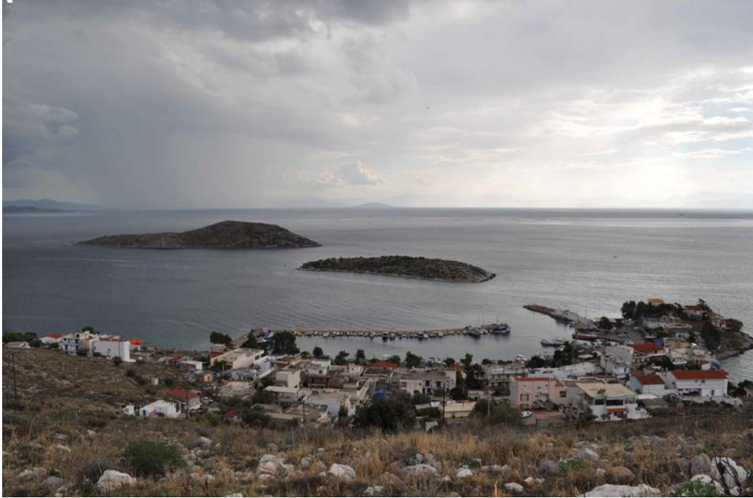
Άποψη Πάχης απο ψηλά (Φωτογραφία 1)