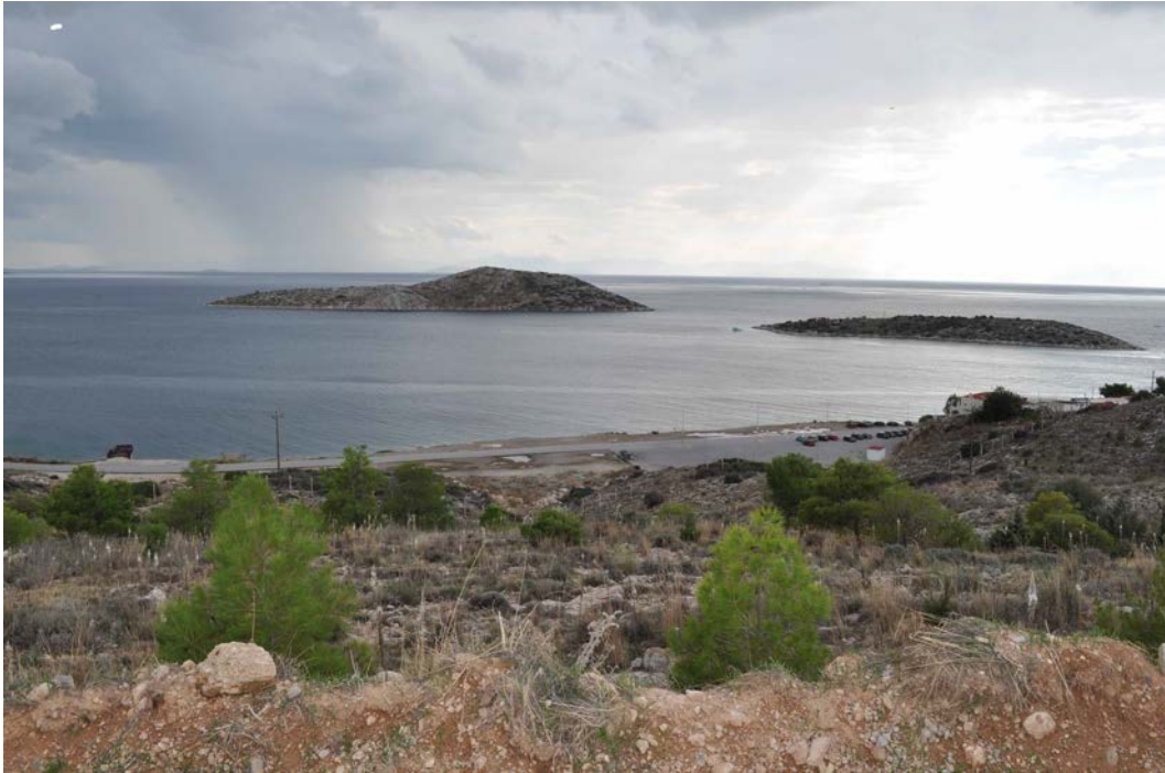
Πανοραμική άποψη τμήματος ανάπτυξης ( φωτογραφία 11 )