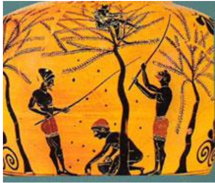
Μελανόμορφο αγγείο με θέμα τη συγκομιδή ελαιοκάρπου

Αναφορικά τώρα με τον πληθυσμό των Μεγάρων κατά την αρχαιότητα, πάλι θα συμβουλευτούμε ως πηγή τον πανεπιστήμονα Αριστοτέλη . Αυτός διατείνεται ότι μια ‘πόλις’ πρέπει να έχει τόσο πλήθος , όσο χρειάζεται για να διατηρεί την αυτάρκειά της. Σε ένα χωρίο των Πολιτικών αναφέρει ενδεικτικά ορισμένες πόλεις και συγχρόνως τον πληθυσμό τους. Ανάμεσα σε αυτές περιλαμβάνονται και τα Μέγαρα με πληθυσμό 5,000-10,000 κατοίκους , αριθμός ιδανικός για την επίτευξη της αυτάρκειας . Εξάλλου , ας μη λησμονούμε ότι ο αποικισμός ξεκίνησε μόλις η ‘χρυσή’ αλλά εύκολα ανατρέψιμη ισορροπία της αυτάρκειας είχε αρχίσει να απειλείται είτε από την αύξηση του πληθυσμού είτε από κακιές εσοδείες είτε από ισχυρές πολεμικές αναμετρήσεις . Τη μέθοδο του αποικισμού ακολούθησαν και τα Μέγαρα , με πιο χαρακτηριστική την αποικία του Βυζαντίου.