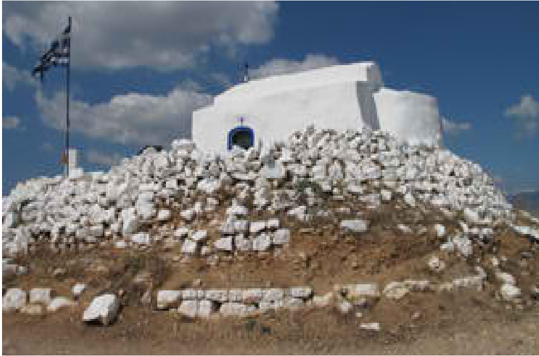
Λόφος Αγίου Γεωργίου (Φωτογραφία 5)

Ο λόφος είναι προσβάσιμος για τον επισκέπτη με αυτοκίνητο ή με τα πόδια και προσφέρει θαυμάσια θέα προς το λιμανάκι της Πάχης με τις βαρκούλες και τα καΐκια των ψαράδων, τη μαγευτική θέα του Σαρωνικού κόλπου με τη Σαλαμίνα, την Αίγινα και τα βουνά της Πελοποννήσου απέναντι, τα τέσσερα νησάκια: μικρό νησί (Παχοπούλα), μεγάλο νησί (Πάχη) Ρεβυθούσα και Μακρονήσι που βρίσκονται ανάμεσα στην Πάχη και τη Σαλαμίνα και οι αρχαίοι τα έλεγαν «Μεθουρίδες» (Υπάρχει στα Μέγαρα και οδός Μεθουρίδων δίπλα από το παλιό ταχυδρομείο), το καταπληκτικό ηλιοβασίλεμα, την πόλη των Μεγάρων, τον κάμπο με τον ελαιώνα, και τα βουνά Γεράνεια και Πατέρας.