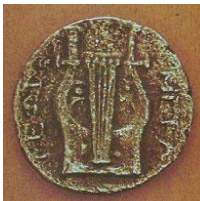
Αργυρό νόμισμα 7ου π.Χ αιώνα

Ένδειξη αυτονομίας θεωρείται και το γεγονός ότι κάθε πόλη κράτος έκοβε και κυκλοφορούσε το δικό της νόμισμα, που συχνά έφερε εγχάρακτα το τοπωνύμιο και κάποια σύμβολα της πόλης ή άλλοτε τη μορφή κάποιου σημαίνοντος προσώπου . Ούτε σε αυτή την περίπτωση τα Μέγαρα εξαιρούνται. Μάλιστα, από τα νομίσματα που έχουν βρεθεί αντλούμε πληροφορίες για την ιστορία και την οικονομική και κοινωνική ταυτότητα της πόλης . Για παράδειγμα οι Μεγαρείς για να τιμήσουν τον οικιστή Βύζαντα, τον ιδρυτή του Βυζαντίου, αποτύπωσαν τη μορφή του σε αργυρό νόμισμα του 7ου π.Χ αιώνα. Σε άλλο πάλι νόμισμα απεικονίζεται ο Ευκλείδης , ο γνωστός Μεγαρέας φιλόσοφος του 5ου π.Χ αιώνα.