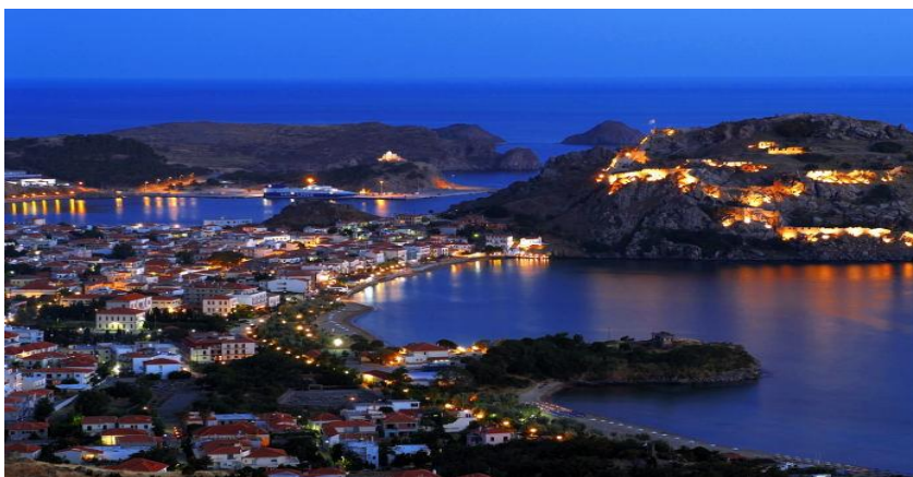
Εικόνα 1: Μύρινα, Λήμνος

Η Λήμνος βρίσκεται στο Θρακικό πέλαγος στο Βόρειο Αιγαίο, μεταξύ του Αγίου Όρους της Σαμοθράκης, της Ίμβρου και της Λέσβου. Είναι το όγδοο μεγαλύτερο νησί της Ελλάδας με έκταση 476 τετραγωνικά χιλιόμετρα και το τέταρτο σε μήκος ακτών με 260 χιλιόμετρα. Μαζί με τον Άγιο Ευστράτιο αποτελούν την επαρχία Λήμνου του Νομού Λέσβου. Η Μύρινα είναι η πρωτεύουσα και το κύριο λιμάνι του νησιού. Βάσει της απογραφής του 2011, ο πληθυσμός του νησιού ανέρχεται σε 17.000 κατοίκους, να σημειωθεί ότι βάσει της απογραφής του 2001 ο πληθυσμός ήταν περίπου 18.000.