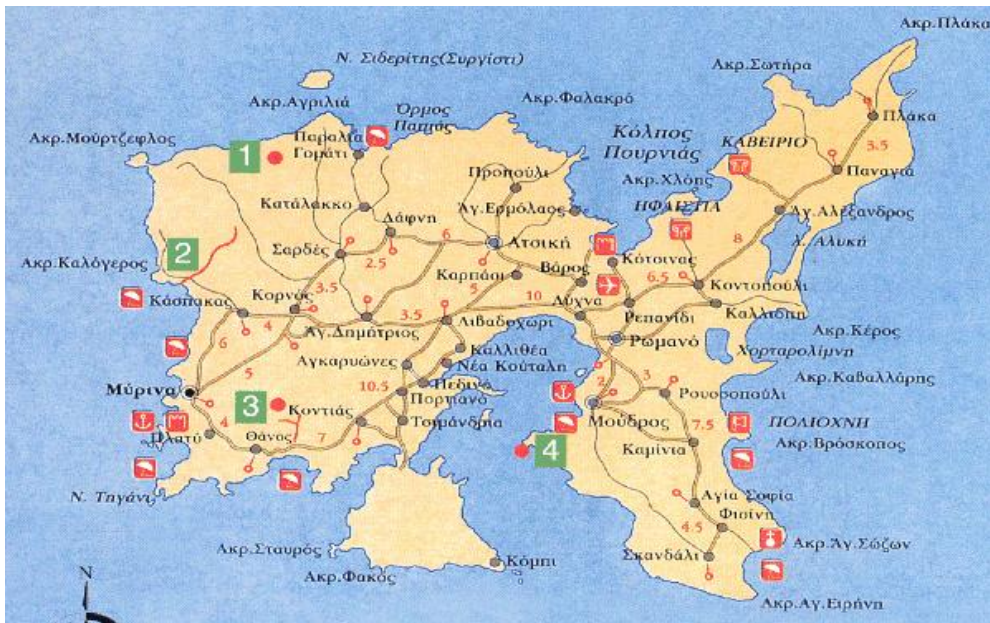
Εικόνα 3: Το Νησί της Λήμνου