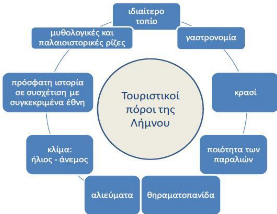
Εικόνα 7: Τουριστικοί Πόροι της Λήμνου

Όλα αυτά αν συνδυαστούν σωστά μπορούν να διαμορφώσουν ένα ανταγωνιστικό τουριστικό προϊόν, μέσω της ανάπτυξης εναλλακτικών μορφών τουρισμού, όπως είναι ο οικοτουρισμός, ο θαλάσσιος τουρισμός, ο θρησκευτικός τουρισμός, ο περιπατητικός τουρισμός, ο τουρισμός που θα προωθεί την παρατήρηση της φύσης σε μέρη όπως είναι οι προστατευόμενοι υδροβιότοποι.