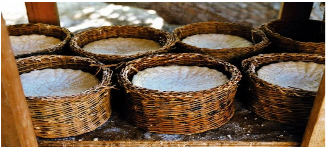
Εικόνα 6: Τοπικό Προϊόν «Καλαθάκι Λήμνου»

Η Λήμος διαθέτει τοπικά προϊόντα όπως είναι το παραδοσιακό τυρί «Καλαθάκι Λήμνου», πρόκειται για Προϊόν Ονομασίας Προέλευσης. Το συγκεκριμένο τυρί έχει αρκετά μεγάλη ζήτηση τόσο στην εγχώρια αγορά, όσο και στο εξωτερικό, έτσι υπάρχει εξασφαλισμένη υψηλή τιμή του γάλακτος. Παρόμοιο τυρί του νησιού είναι και το «ΜΕΛΙΧΛΩΡΟ». Επίσης η Λήμος διαθέτει φέτα ως αναγνωρισμένο προϊόν με τον διακριτικό τίτλο «ΠΟΠ Τυρί Φέτα».