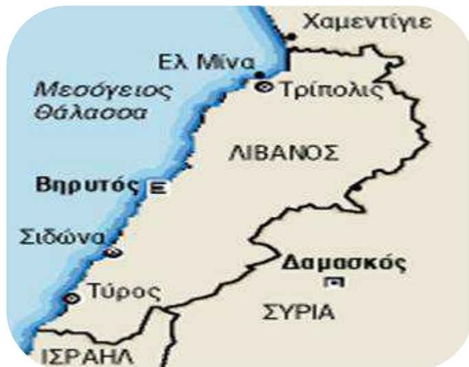
Εικόνα 2 Χάρτης Γεωγραφικών περιοχών Λιβάνου

Το 1860, μετά από εμφύλιες διαμάχες που είχαν για στόχο τη χριστιανική κοινότητα του Λιβάνου, η Γαλλία προχώρησε σε στρατιωτική επέμβαση στην περιοχή, που είχε ως αποτέλεσμα την επιβολή καθεστώτος αυτονομίας στο Λίβανο, κάτω από την επίβλεψη του σουλτάνου (1861), τη δημιουργία της "ζώνης της Βηρυτού" και την