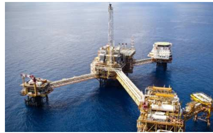
Εικόνα 6 Γεώτρηση ανεύρεσης πετρελαίου

Ο πόλεμος του πετρελαίου για το ποιος θα καταφέρει να ενισχύσει την θέση του στην ευρωπαϊκή αγορά μαίνεται. Η σύγκρουση προς