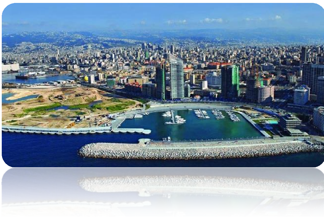
Εικόνα 3 Πανοραμική άποψη Βηρυττού

Η Βηρυττός είναι μια εύθραυστη πολυεθνική και πολυθρησκευτική πόλη, που αποτελεί ένα από τα πιο φλεγόμενα μέρη του κόσμου. Στον Λίβανο γίνονται επί δεκαετίες πόλεμοι, ενώ παίζονται τεράστια γεωπολιτικά παιχνίδια από τις μεγάλες δυνάμεις. Είναι τόσες πολλές οι συγκρουόμενες τάσεις στη χώρα αυτή, που είναι κυριολεκτικά αδύνατες οι μονοσήμαντες πολιτικές αναλύσεις.