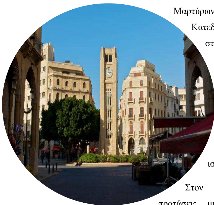
Εικόνα 5 Το κέντρο της Βυρηττού

Tabet αναλαμβάνει να συνθέσει. Η πρόταση που προκύπτει διατηρεί τη ρυμοτομία της παλιάς πόλης προσθέτοντας κάποιους ανοικτούς χώρους, και εντάσσοντας την αγορά στον αρχαιολογικό χώρο, στο επάνω μέρος του αρχαίου τείχους με τη δημιουργία ενός σύγχρονου περιπάτου στο κάτω μέρος του. Η πρόταση, απορρίπτεται