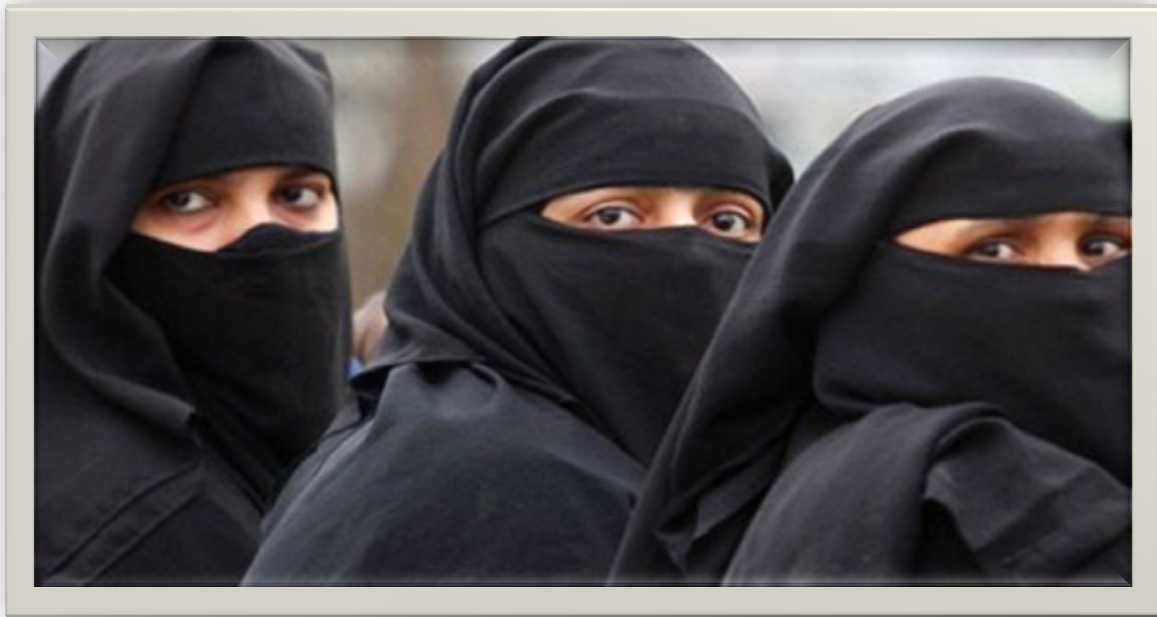
Εικόνα 4 Μουσουλμάνες με την χαρακτηριστική αμφίεση