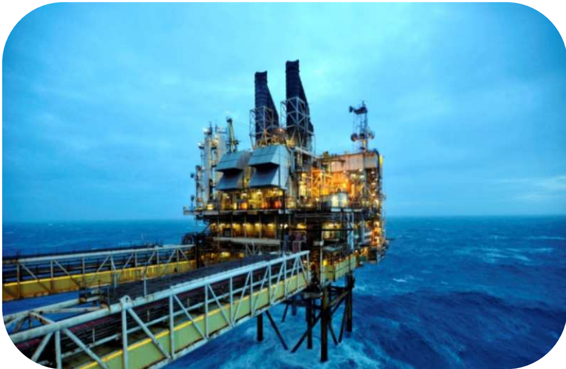
Εικόνα 7 Γεώτρηση για την ανεύρεση πετρελαίου

Το παιχνίδι αρχίζει να γίνεται πολύπλοκο καθώς σε αυτό εμπλέκεται και το Ιράν. Η