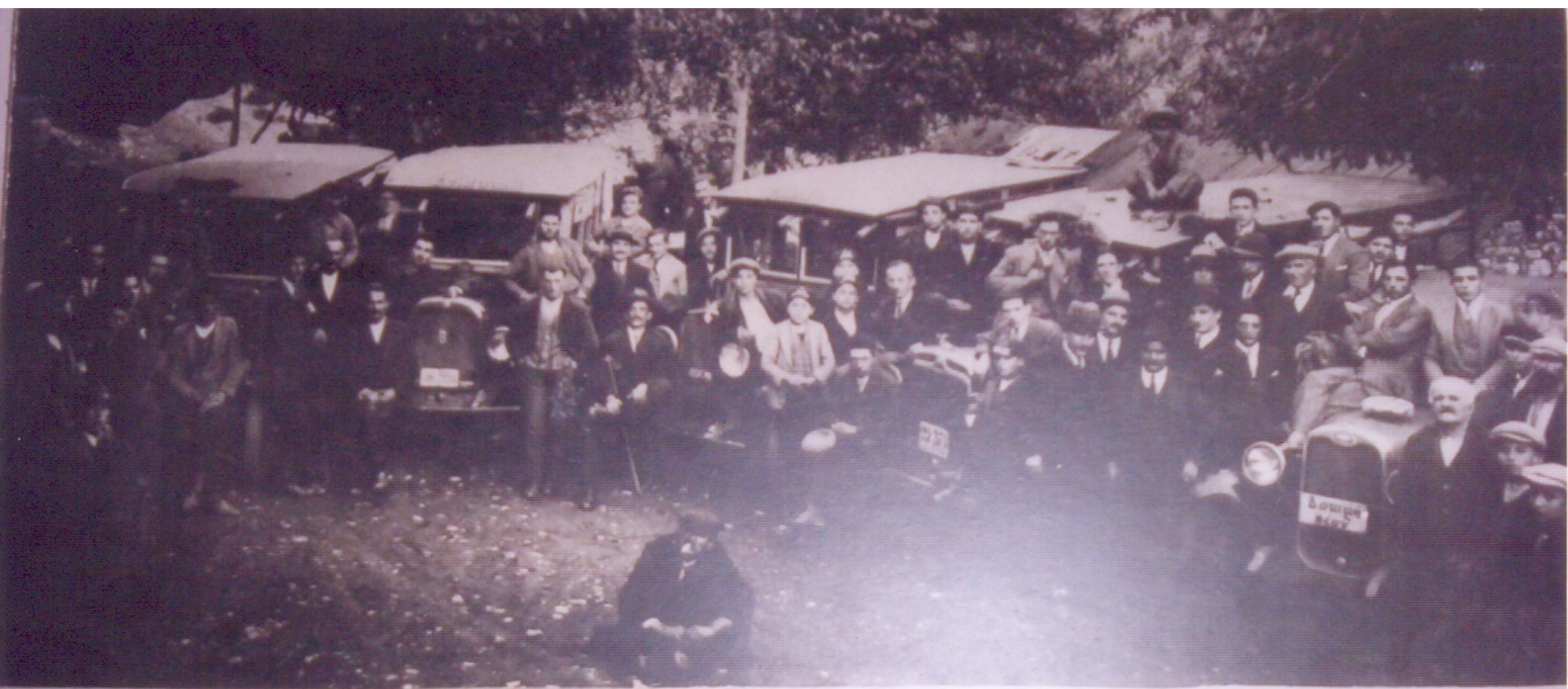
‘Η πρώτη άφιξις αυτοκινήτων εις την συνοικίαν «Γαῦρος» τοῦ Μεγάλου Χωρίου 28ην Νοεμβρίου 1929.