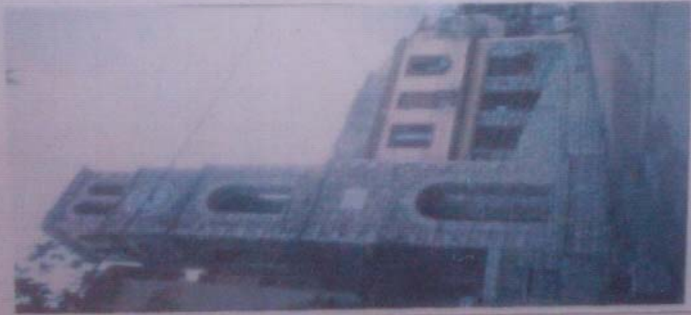
Το ρολόι του χωριού