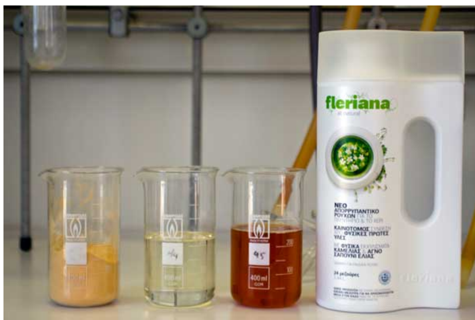
Εικόνα 2: Fleriana, το πρώτο φυσικό απορρυπαντικό.

Η μελέτη οδήγησε στον εντοπισμό και κατάλληλο συνδυασμό φυσικών και φυσικής προέλευσης συστατικών για την παραγωγή εξαιρετικά αποτελεσματικών προϊόντων, τα οποία δε θα είναι ερεθιστικά για τα μάτια ή το δέρμα και παράλληλα θα είναι φιλικά προς το περιβάλλον. Όλες οι πρώτες ύλες προέρχονται από ανανεώσιμες πηγές. Επιπλέον, η παραγωγική διαδικασία είναι ιδιαίτερος απλή με δυνατότητα εφαρμογής σε βιομηχανική κλίμακα. Το αποτέλεσμα αυτής της μελέτης είναι η παρασκευή του πρώτου φυσικού απορρυπαντικού, όμοιο του οποίου δεν υπάρχει σε όλη την Ευρώπη, του «Fleriana» (βλ. εικόνα 2). (Δημουλάς 2013, www.kainotomeis.gr )