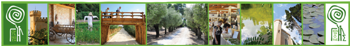
Εικόνα 5: Κέντρο της Γης – πρότυπο ανοιχτό κέντρο περιβαλλοντικής εκπαίδευσης. Αποτελεί το ορμητήριο για τη συνολική δραστηριότητα της Οργάνωσης Γη.

ενδιαφέρονται να ασχοληθούν επαγγελματικά με τη βιολογική γεωργία. Η βιολογική γεωργία έχει τα μεγαλύτερα περιθώρια ανάπτυξης στη χώρα μας καθώς αποτελεί μόνο το 2% της ελληνικής παραγωγής, ενώ ο μέσος όρος της βιολογικής γεωργικής παραγωγής της Ε.Ε. προσεγγίζει το 10%. ( www.organizationearth.org )