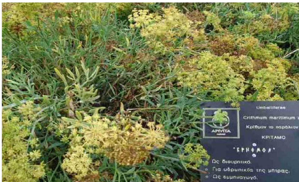
Εικόνα 3: Η εταιρεία APIVITA υποστηρίζει και μετέχει στην ανασύσταση του Κήπου του Ιπποκράτη στην Κω .

Τα προϊόντα της APIVITA φτιάχτηκαν αρχικά στο οικογενειακό φαρμακείο και σήμερα εξάγονται σε πάνω από 20 χώρες. (Εθνικό Παρατηρητήριο για τις Μικρομεσαίες Επιχειρήσεις, www.apivita.com/hellas )