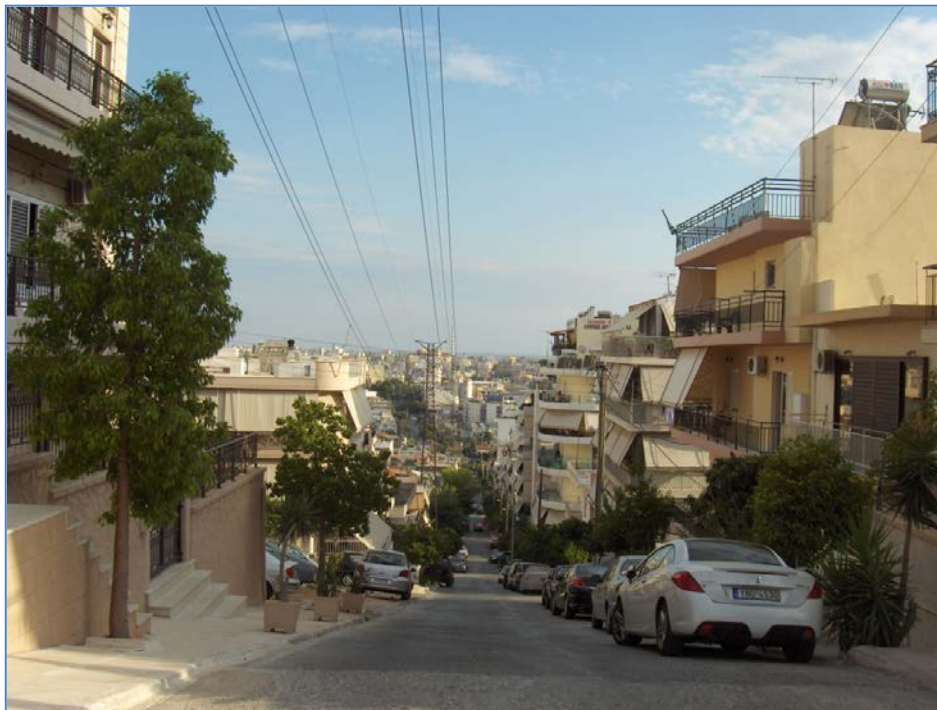
Θέα από τις γειτονίες στους πρόποδες του όρους Αιγάλεω