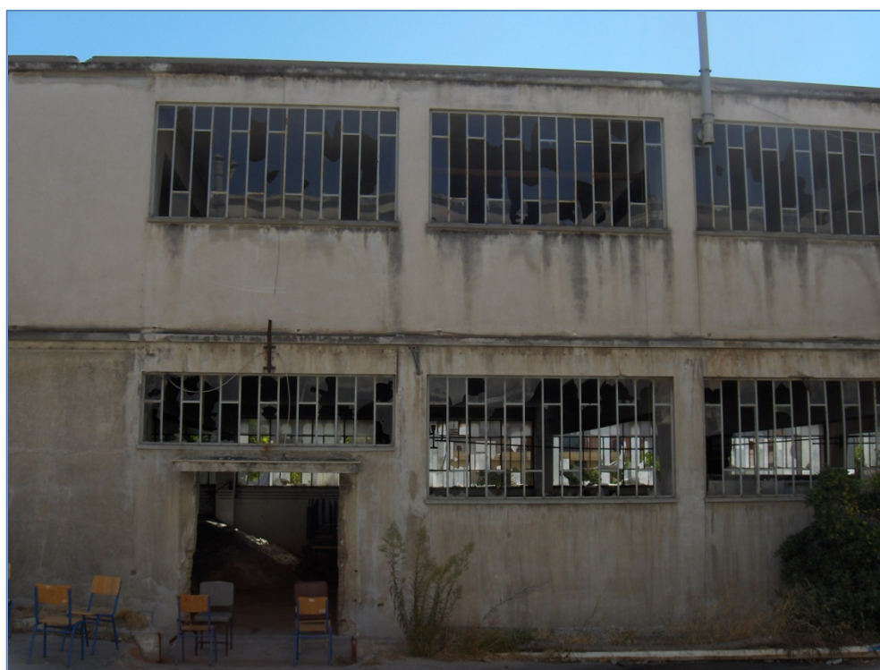
Η εγκατάλειψη είναι βασικό στοιχείο της σημερινής κατάστασης του εργοστασίου