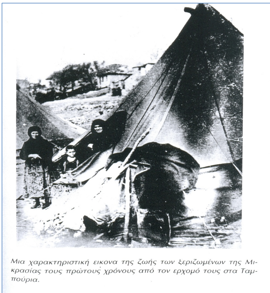
Μια χαρακτηριστική εικόνα της ζωής των ξεριζωμένων της Μικρασίας τους πρώτους χρόνους από τον ερχομό τους στα Ταμπύρια.

οποίους πολέμησαν, νιώθοντάς τους τμήμα του εθνικού σώματος, αλλά που τελικά έγινε φανερό με την άφιξή τους ότι ήταν πολύ διαφορετικοί. Όσο διαρκούσε η Μικρασιατική εκστρατεία, οι άνθρωποι αυτοί παρουσιάζονταν ως αλύτρωτοι Έλληνες αδερφοί. Όταν όμως έφτασαν στην Ελλάδα, οι ντόπιοι διαπίστωσαν ότι μια μερίδα προσφύγων δεν μιλούσαν καν ελληνικά, ενώ είχε καθαρά ανατολίτικες συνήθειες (οι γυναίκες κάπνιζαν ναργιλέ, ντύνονταν ιδιόμορφα και άκουγαν αμανέδες).