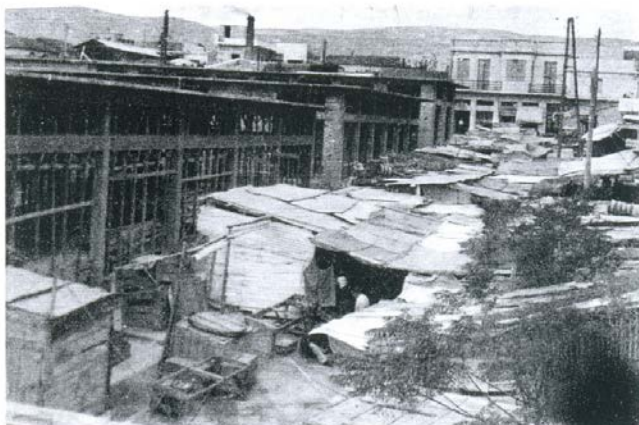
Αυτά τα πανάθλια ερείπια ήταν πρώτα η Δημ. Αγορά Κερατσινίου.

Κατά τη διάρκεια του 1930 , στη βιομηχανική ζώνη , που ουσιαστικά εκτεινόταν από τον Πειραιά μέχρι το Πέραμα , βρισκόταν συγκεντρωμένη η βαριά βιομηχανία ολόκληρης της χώρας. Στο Κερατσίνι λειτουργούσαν το θερμοηλεκτρικό εργοστάσιο της αγγλικής POWER , η τσιμεντοβιομηχανία «ΑΓΕΤ ΗΡΑΚΛΗΣ» , η Εταιρεία Λιπασμάτων που απασχολούσε περίπου 5.000 εργαζομένους , το εργοστάσιο ναφθαλίνης ΝΑΦΘΑ , το ναυπηγείο Βασιλειάδη , οι Μύλοι Αγίου Γεωργίου , το στρατιωτικό εργοστάσιο παραγωγής στρατιωτικών στολών ΚΟΠΗ με 2.000 εργαζομένους και αρκετές μονάδες υφαντουργίας. Σ' αυτά θα πρέπει να συνυπολογίσουμε και έναν ικανό αριθμό μικρότερων αλλά σημαντικών μονάδων , όπως τα σαπουνάδικα , τα ταμπάκικα , τα γυαλάδικα , τα γυνάδικα και τα μικρά υφαντήρια χαλιών.