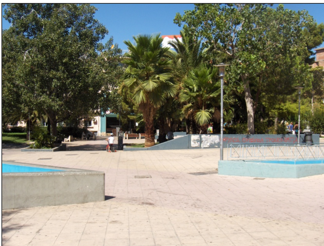
Όψη πλατείας Λαού