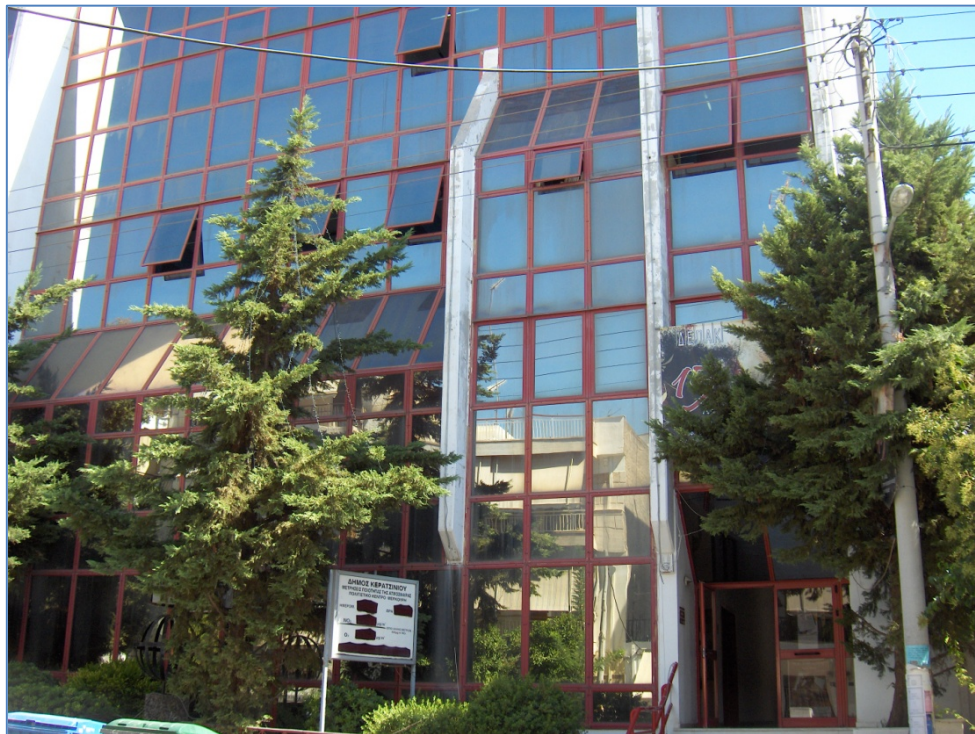
Πολιτιστικό κέντρο Κερατσινίου «Μελίνα Μερκούρη» στην Αμφιάλη

πάρκο Σελεπίτσαρι ή Ανδρέας Παπανδρέου. Το πάρκο Σελεπίτσαρι , τοποθετημένο στο παλιό λατομείο της περιοχής , διαθέτει ανοιχτό θέατρο , μονοπάτια για πεζοπορία και είναι ο χώρος που διαδέχθηκε το πάρκο Πρεσσόφ στη φιλοξενία του Φεστιβάλ Νεολαίας. Στην Αμφιάλη επίσης λειτουργεί το πολιτιστικό κέντρο του Δήμου «Μελίνα Μερκούρη» το οποίο και προσφέρει στους δημότες μαθήματα τέχνης αλλά και μια πλούσια βιβλιοθήκη.