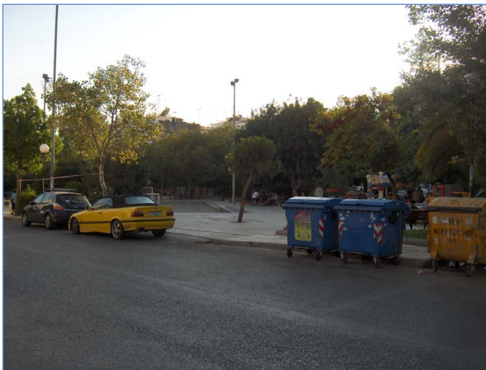
Πάρκο στην περιοχή του Αγίου Αντωνίου