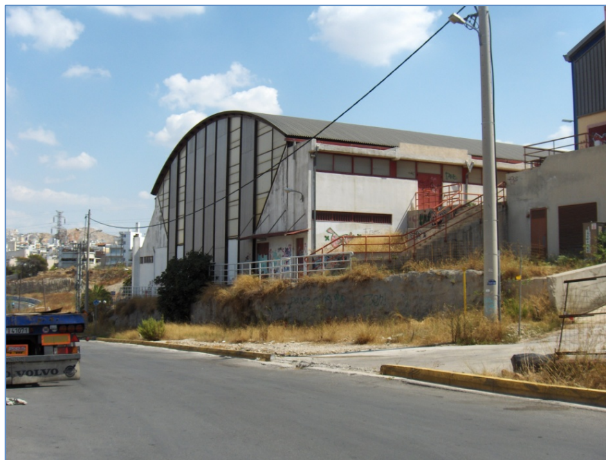
Κλειστό γυμναστήριο και κολυμβητήριο Ιχθυόσκαλας