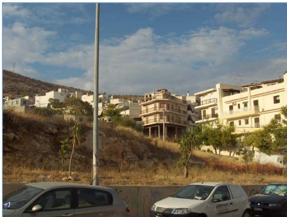
Η οικοδομική δραστηριότητα κοντά στο όρος Αιγάλεω συνεχίζεται ακόμα και σήμερα