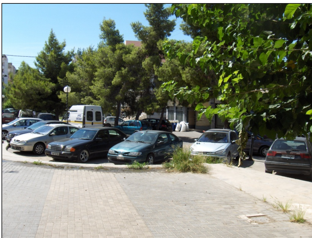
Πεζόδρομος κοντά στο εμπορικό κέντρο Ταμπουρίων που δείχνει το πρόβλημα με τη στάθμευση που δημιουργείται στην περιοχή.