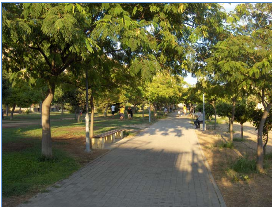
Πάρκο Σελεπίτσαρι – Ανδρέας Παπανδρέου