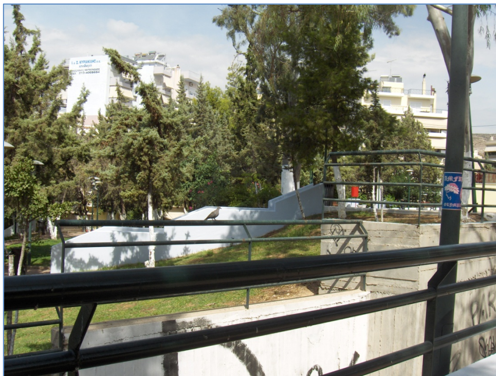
Πάρκο γύρω από το ναό της Παναγίας Βλαχερνών