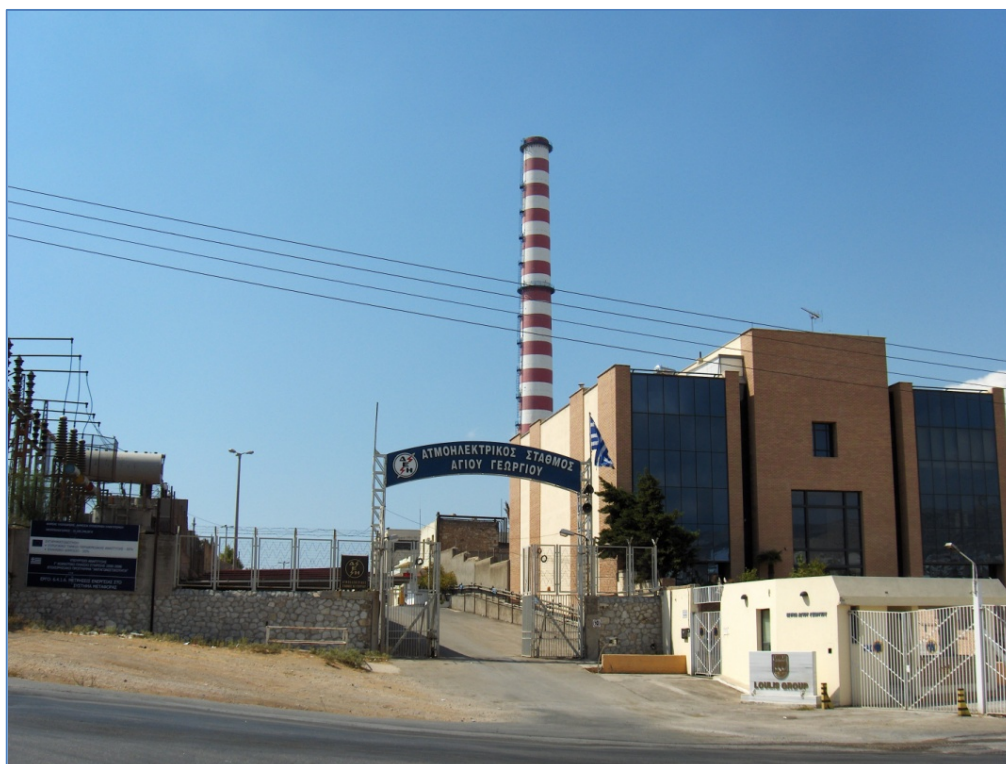
Εργοστάσιο παραγωγής ηλεκτρικής ενέργειας