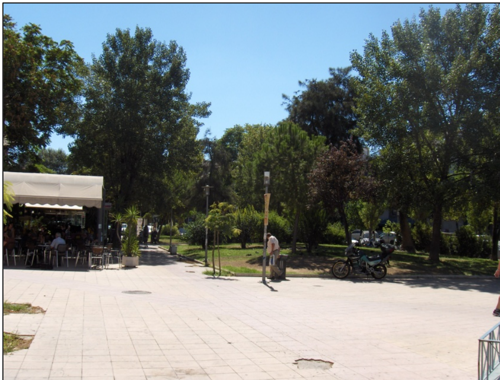
Άλλη όψη της πλατείας Λαού