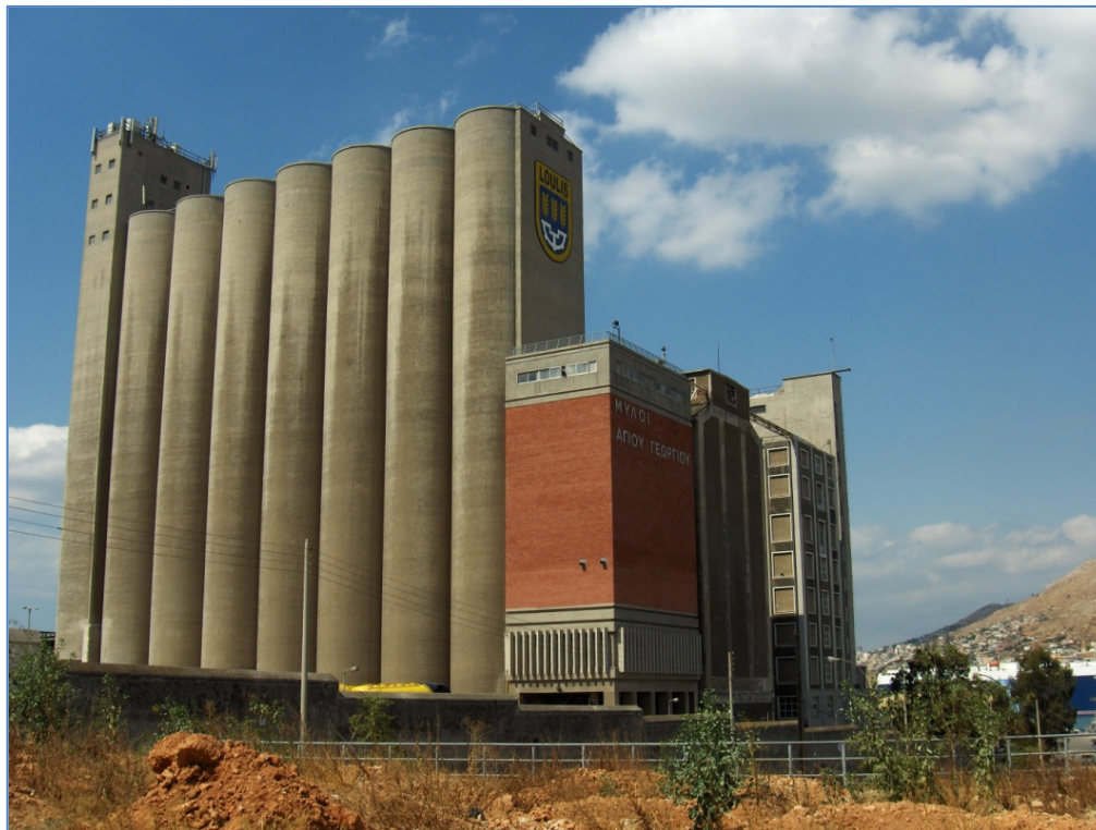
Μύλοι Αγίου Γεωργίου