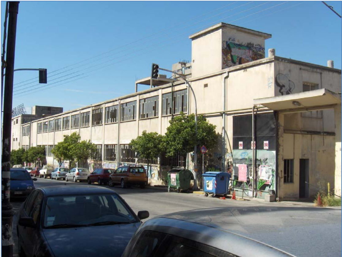
Όψη οδού Κωνσταντινουπόλεως

χρησιμοποιείται σε ένα πολύ μικρό κομμάτι του ως χώρος ανακύκλωσης ηλεκτρικών συσκευών. Παίρνοντας σαν δεδομένο ότι πολύ κοντά στο εν λόγω εργοστάσιο βρίσκεται το υπερτοπικό κέντρο του δήμου καθώς και το πάρκο «Ανδρέας Παπανδρέου», ο χώρος θα πρέπει να αξιοποιηθεί για την αποφόρτιση της περιοχής.