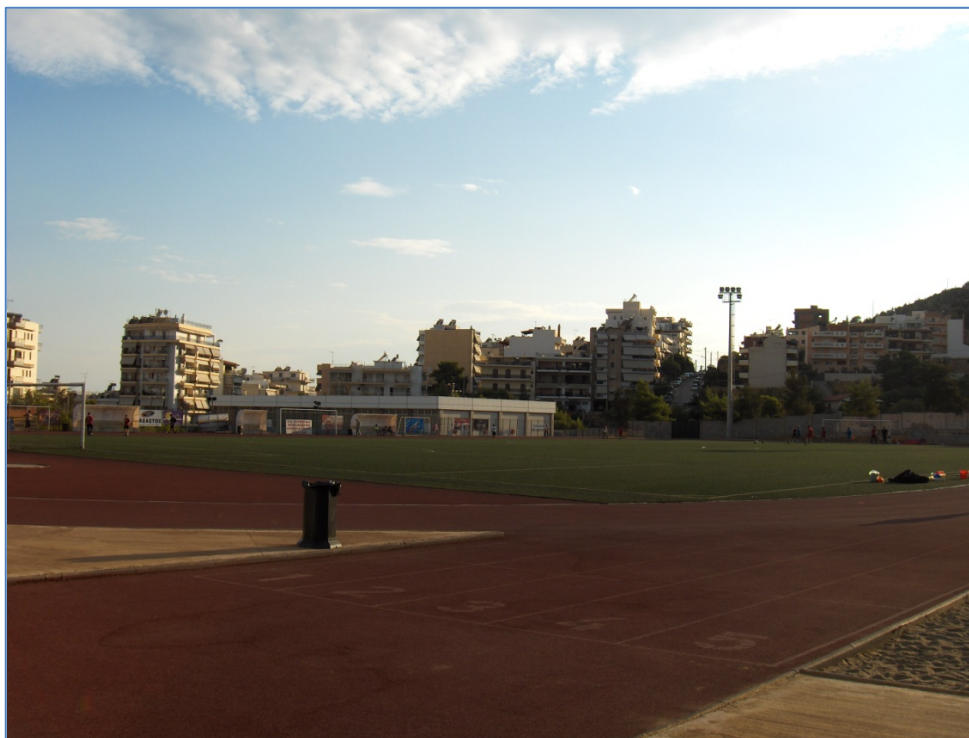
Δημοτικό Στάδιο Κερατσινίου στις Σιταποθήκες