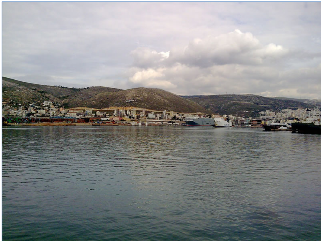
Λιμάνι Αγίου Γεωργίου