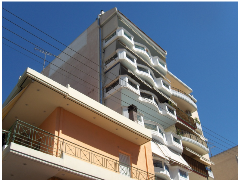
Πολυκατοικίες κοντά στο εμπορικό κέντρο των Ταμπουρίων