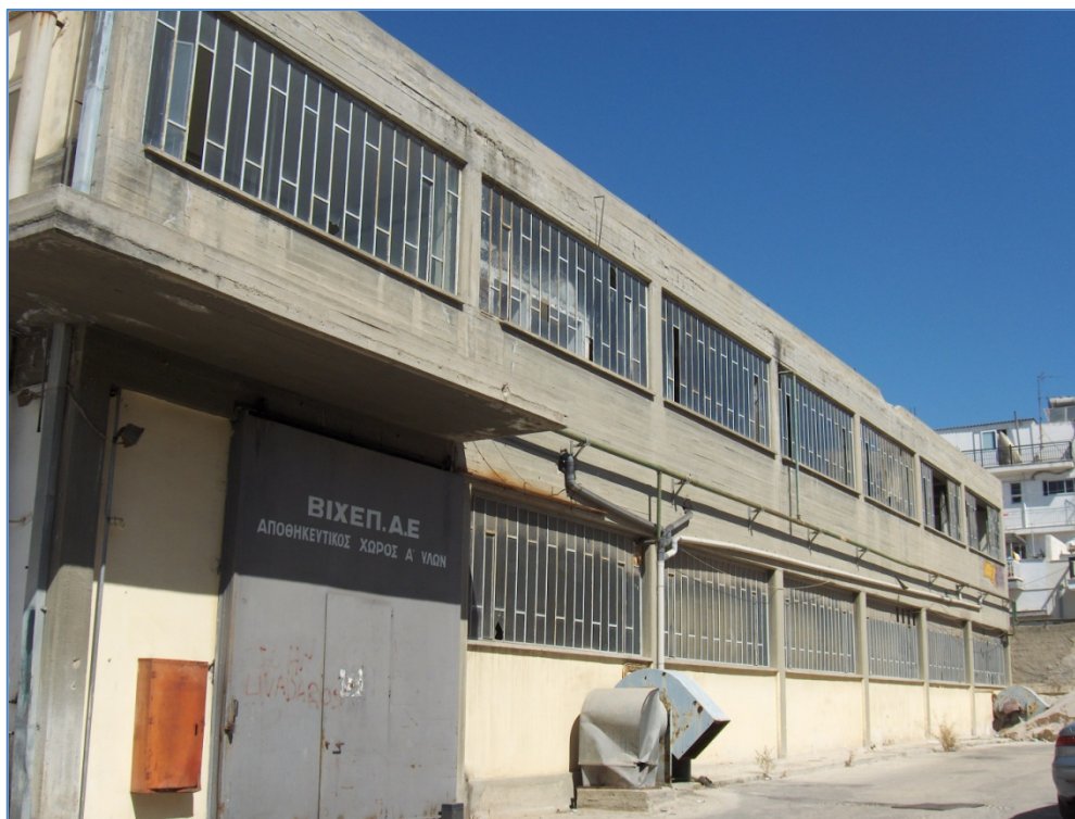
Ο μικρός χώρος που αξιοποιείται σήμερα