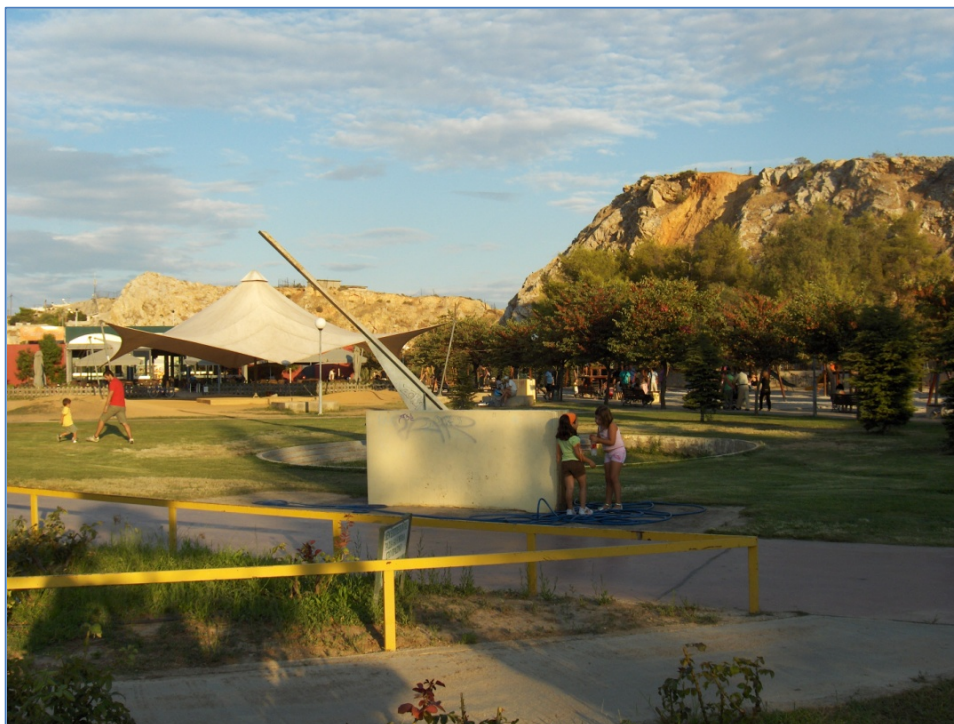
Πάρκο Σελεπίτσαρι – Ανδρέας Παπανδρέου