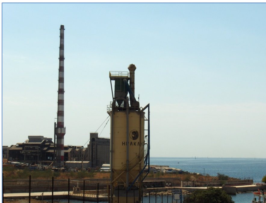
Εργοστάσιο τσιμέντων ΑΓΕΤ ΗΡΑΚΛΗΣ