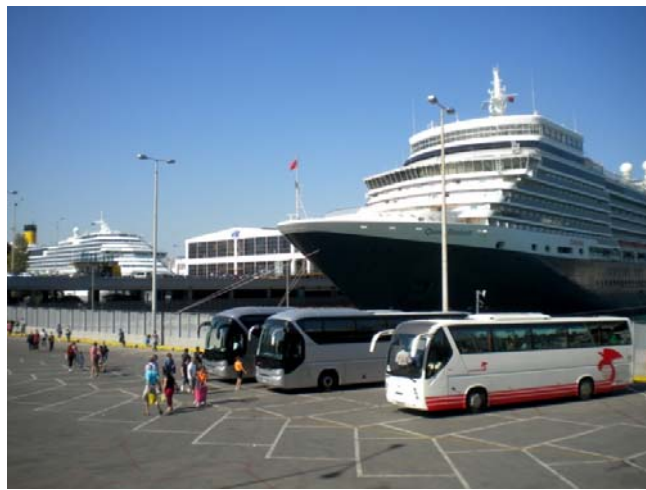
Εικόνα 21 Το κρουαζιερόπλοιο Queen Elisabeth στο Μέγαρο του ΟΛΠ

του Πειραιά, στα πλαίσια Κρουαζιέρας. Για να το πετύχει αυτό το τμήμα σε συνεργασία με τις αρμόδιες Αρχές προσπαθεί να αναβαθμίζει συνεχώς τις εγκαταστάσεις του ΟΛΠ που βρίσκονται στην περιοχή Κρουαζιέρας του Λιμένα, και παρέχει όσο το δυνατόν καλύτερες υπηρεσίες στους επιβάτες των κρουαζιερόπλοιων. Επιπλέον μελετά και υποβάλλει προτάσεις για παροχή νέων υπηρεσιών και δραστηριοτήτων που θα διευκολύνουν τόσο τους επιβάτες όσο και τα κρουαζιερόπλοια που φτάνουν στο λιμάνι του Πειραιά.