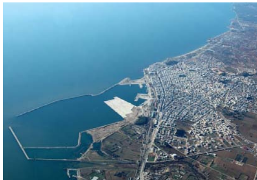
Εικόνα 6 Λιμένας Αλεξανδρούπολης

Σήμερα η «Οργανισμός Λιμένος Αλεξανδρούπολης Α.Ε.» έχει στη δικαιοδοσία της το λιμένα Αλεξανδρούπολης, το αλιευτικό καταφύγιο Μάκρης, το λιμάνι Καμαριώτισσας ν. Σαμοθράκης και το αλιευτικό καταφύγιο Θέρμων ν. Σαμοθράκης.