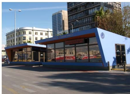
Εικόνα 17 Επιβατικός Σταθμός Αγίου Λιονυσίου