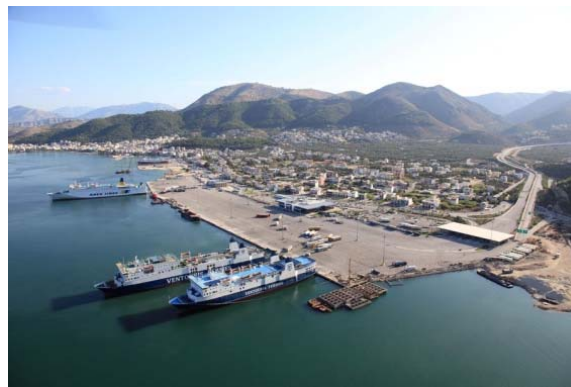
Εικόνα 9 Λιμένας Ηγουμενίτσας

Το νέο λιμάνι της Ηγουμενίτσας εγκαινιάστηκε το 2003 και αποτελεί συγκοινωνιακό κόμβο, καθώς εκεί συγκλίνουν οι άξονες Εγνατίας και Ιόνιας Οδού, επιτρέποντας μετακινήσεις σε ολόκληρη την Ελλάδα και το εξωτερικό.