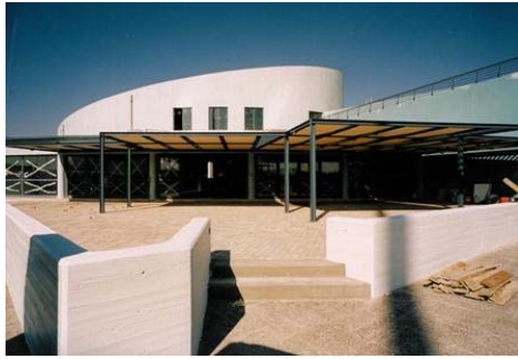
Εικόνα 16 Επιβατικός Σταθμός Ακτής Βασιλιάδη