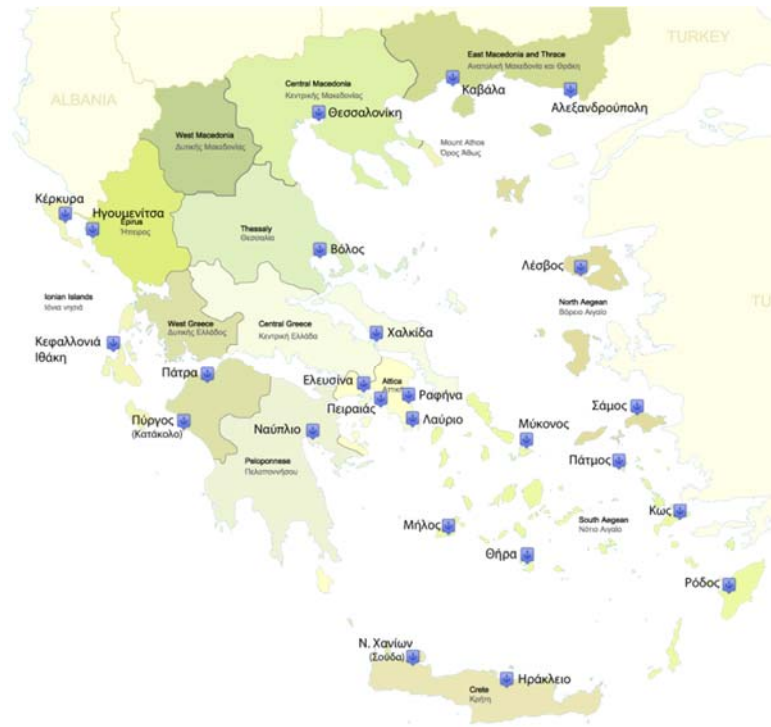
Εικόνα 1 Μέλη της Ε.ΛΙ.Μ.Ε.

Η Ένωση Λιμένων Ελλάδος στοχεύει: i) στην ανάπτυξη λιμενικής πολιτικής που θα διευκολύνει τις δραστηριότητες των μελών της, ii) τη συμμετοχή των λιμένων στην περιφερειακή ανάπτυξη και iii) την δημιουργία επιχειρήσεων παροχής λιμενικών υπηρεσιών που να καλύπτουν τις ανάγκες που προκύπτουν από τη χρήση των λιμένων και οι οποίες θα πρέπει να είναι ανταγωνιστικές.