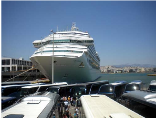
Εικόνα 22 Το Costa Magica στο Μέγαρο του ΟΛΠ

Οι ναυτιλιακές εταιρείες πληρώνουν στον ΟΛΠ για τη χρήση του λιμένα από τα κρουαζιερόπλοια και την εξυπηρέτηση των επιβατών ποσά που αντιστοιχούν στα δικαιώματα του ΟΛΠ, τα οποία υπολογίζονται από το Τμήμα Κρουαζιέρας και εισπράττονται από το Τμήμα Εσόδων.