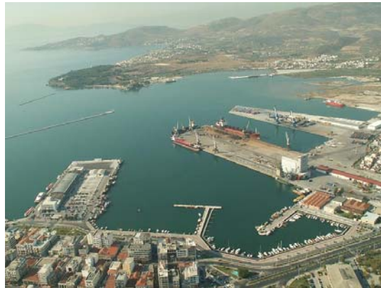
Εικόνα 12 Λιμένας Βόλου

Το Λιμενικό Ταμείο Βόλου ιδρύθηκε το 1881 και είχε σαν στόχο την κατασκευή έργων υποδομής για την καλύτερη λειτουργία του λιμανιού. Αρχικά λειτούργησε σαν Ν.Π.Δ.Δ. υπό την εποπτεία του ΥΕΝ και το 1973 ενοποιήθηκε με το Λιμενικό Ταμείο Σκοπέλου, με ονομασία Λιμενικό Ταμείο Μαγνησίας.