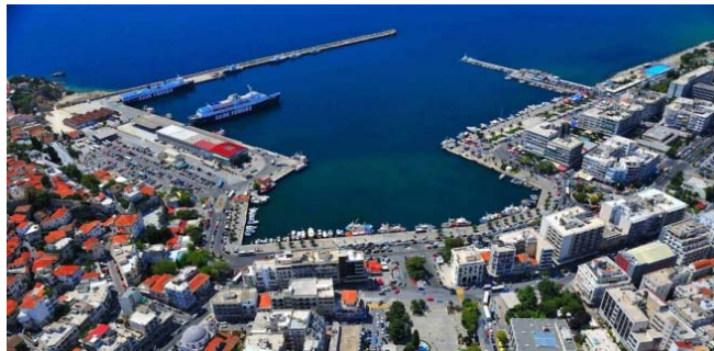
Εικόνα 8 Λιμένας Καβάλας

Η εμπορική κίνηση εξυπηρετείται από το λιμάνι Φίλιππος Β', η αλιεία και μικρό ποσοστό εμπορευματικής κίνησης γίνεται από το λιμάνι Ελευθερών, ενώ το λιμάνι της Κεραμωτής μεταφέρει κυρίως τουρίστες στο νησάκι της Θάσου, αλλά χρησιμοποιείται και στη μεταφορά εμπορευμάτων των επιχειρήσεων της περιοχής.