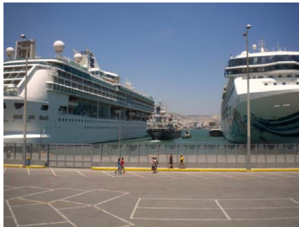
Εικόνα 20 Υδροδότηση κρουαζιερόπλοιων Splendour of the Seas και Norwegian Spirit

Το Τμήμα Υδροδότησης εκμεταλλεύεται τα δίκτυα παροχής νερού που βρίσκονται στην κατοχή του Οργανισμού για την υδροδότηση των πλοίων και των εγκαταστάσεων. Για τη σωστή χρήση και εκμετάλλευση των δικτύων παροχής νερού τηρεί αρχείο υδροδότησης, αποστέλλει στοιχεία και εκδίδει χρεωστικά σημειώματα στο Τμήμα Εσόδων για έκδοση τιμολογίων και υπολογισμό δικαιωμάτων που βαρύνουν κάθε υδροδοτούμενο. Ελέγχει τους λογαριασμούς κατανάλωσης ύδατος από τις Υπηρεσίες του ΟΛΠ και εκδίδει εντολές πληρωμής για την εξόφληση τους.