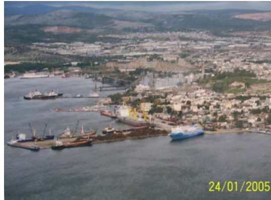
Εικόνα 2 Λιμένας Ελευσίνας

Στόχος της Ο.Λ.Ε. Α.Ε. είναι να μετατρέψει το λιμάνι σε κομβικό σημείο αυξάνοντας την εμπορευματική κίνηση σε Ελλάδα και εξωτερικό. Αυτό μπορεί να επιτευχθεί εν μέρη με τη βοήθεια του σιδηροδρομικού δικτύου της περιοχής.