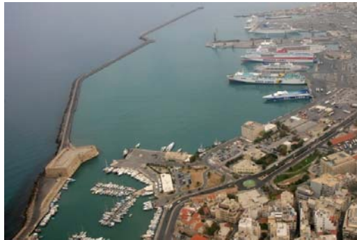
Εικόνα 13 Λιμένας Ηρακλείου

Το λιμάνι του Ηρακλείου συνδέει την Κρήτη με την ηπειρωτική Ελλάδα με καθημερινά δρομολόγια επιβατικών πλοίων, μεταφέροντας επιβάτες και εμπορεύματα ενώ τα τελευταία χρόνια επισκέπτονται το λιμάνι κρουαζιερόπλοια, αυξάνοντας την τουριστική κίνηση του νησιού.