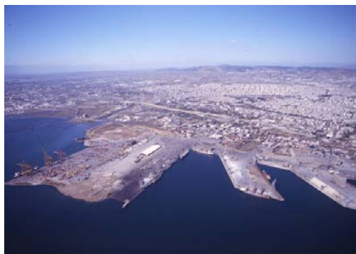
Εικόνα 7 Λιμένας Θεσσαλονίκης

Το 1930 ιδρύθηκε το Λιμενικό Ταμείο Θεσσαλονίκης με σκοπό την ορθή διαχείριση του λιμένα, η οποία το 1970 ανατέθηκε στον Ο.Λ.Θ.