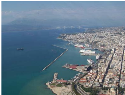
Εικόνα 11 Λιμένας Πάτρας

Το λιμάνι της Πάτρας συνδέει την Δυτική Ελλάδα με τα λιμάνια της Ιταλίας, μεταφέροντας επιβάτες και οχήματα, συμβάλλοντας σημαντικά στη μετακίνηση τουριστών.