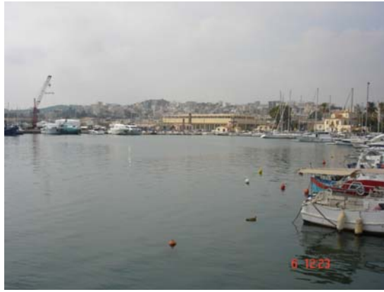
Εικόνα 3 Λιμένας Λαυρίου

Στόχος του Οργανισμού είναι η ανάδειξη του Λαυρίου σε μεγάλο κέντρο ακτοπλοϊκών και εμπορικών γραμμών, με δυνατότητα παροχής υπηρεσιών ελλιμενισμού κρουαζιερόπλοιων.