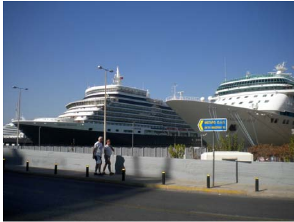
Εικόνα 4 Queen Elisabeth και Splendour of the Seas στο λιμάνι του Πειραιά

Ανάλογα με το είδος των παρεχόμενων υπηρεσιών, οι εγκαταστάσεις του Οργανισμού διακρίνονται σε: 1) λιμάνι εξυπηρέτησης επιβατικής κίνησης, που περιλαμβάνει το κεντρικό λιμάνι και την πορθμειακή γραμμή Σαλαμίνας – Περάματος 2) λιμάνι εξυπηρέτησης εμπορικής κίνησης και 3) λιμάνι εξυπηρέτησης ναυπηγοεπισκευαστικής δραστηριότητας.