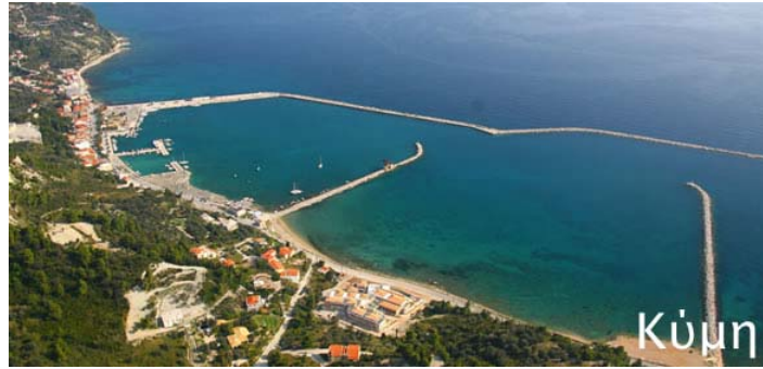
Εικόνα 14 Λιμένας Κόμης

Τα λιμάνια που διαχειρίζεται ο Οργανισμός ενώνουν την Εύβοια με την ηπειρωτική Ελλάδα και τα νησιά της Σκύρου, Σκιάθου και Σκοπέλου, με πορθμειακές και ακτοπλοϊκές γραμμές, ενώ παρέχουν και υπηρεσίες ελλιμενισμού, ρεύμα και νερό στα σκάφη αναψυχής που δένουν στα τουριστικά αγκυροβόλια τους.