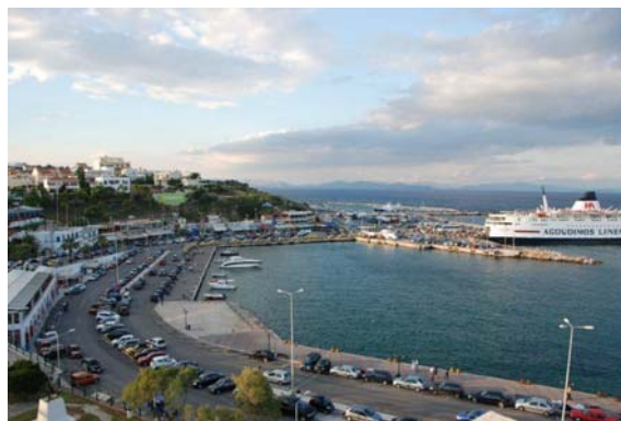
Εικόνα 5 Λιμένας Ραφήνας

Το λιμάνι της Ραφήνας εξυπηρετεί κυρίως μετακίνηση επιβατών και οχημάτων, και σε μικρότερο βαθμό φορτία και εμπορεύματα. Οι υπηρεσίες ελλιμενισμού που προσφέρει ο Οργανισμός στα πλοία είναι η παροχή νερού και η διαχείριση αποβλήτων.