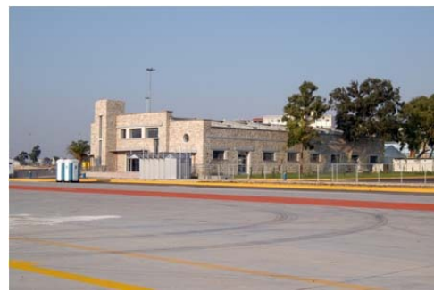
Εικόνα 18 Επιβατικός Σταθμός Ακτής Τζελέπη

Ο Οργανισμός παραχωρεί σε τρίτους χερσαίους χώρους και εγκαταστάσεις έναντι ανταλλάγματος για τη λειτουργία στο λιμάνι βιομηχανικών συγκροτημάτων, κυλικείων, καντινών, αποθηκών τροφοδοσίας, γραφείων πρακτορείων. Επίσης παραχωρεί χώρους για τη λειτουργία ναυπηγοεπισκευαστικών μονάδων στην Επισκευαστική Βάση Περάματος και στην Κυνόσουρα.