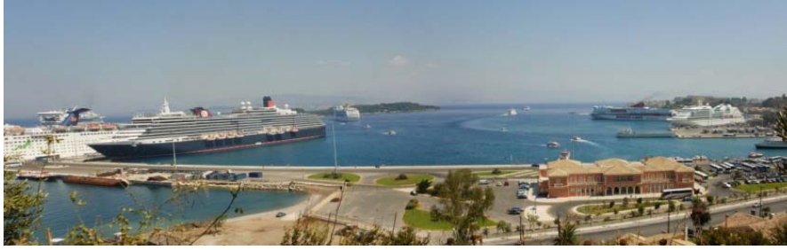
Εικόνα 10 Λιμένας Κέρκυρας

Από το λιμάνι της Κέρκυρας μετακινούνται επιβάτες και οχήματα προς το λιμάνι της Ηγουμενίτσας, τα νησιά του Ιονίου αλλά και το εξωτερικό, με δρομολόγια πλοίων Ελλάδας – Ιταλίας και γραμμών εξωτερικού τρίτων χωρών (Αλβανίας). Επίσης το λιμάνι επισκέπτονται πολλά κρουαζιερόπλοια και σκάφη αναψυχής ενισχύοντας την τουριστική κίνηση του νησιού.