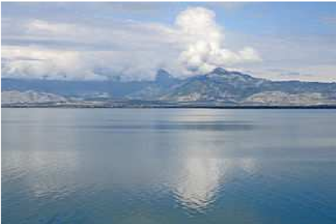
Εικόνα 2: Η λίμνη Σκόδρας 2

πόλεις το Πόγραδετς που βρίσκεται στην αλβανική πλευρά, καθώς και η Οχρίδα και η Στρούγκα που βρίσκονται στην περιοχή της π.Γ.Δ.Μ. Σημαντικός αριθμός ερευνητών υποστηρίζει ότι λίμνη Οχρίδα συνδέεται με τη Μεγάλη Πρέσπα, η οποία βρίσκεται νοτιοανατολικά της Οχρίδας αποτελώντας την τρίτη μεγαλύτερη λίμνη της Βαλκανικής Χερσονήσου. Η λίμνη Μεγάλη Πρέσπα, βρίσκεται στο νοτιοδυτικό τμήμα της χερσονήσου, ενώ μοιράζεται μεταξύ των κρατών Αλβανίας, Ελλάδας και π.Γ.Δ.Μ., με την έκταση της να φθάνει τα 273 τετραγωνικά χιλιόμετρα, ενώ μόλις ένα 18% του συνόλου ανήκει στα αλβανικά εδάφη. Στο νότιο τμήμα της λίμνης, αυτή συνδέεται με τη μικρή Πρέσπα, ενώ βρίσκεται δέκα μέτρα πιο χαμηλά από την τελευταία. Η μικρή Πρέσπα, είναι μια μακρόστενη λίμνη, με το μέγιστο μήκος της να φτάνει τα 13,6 χιλιόμετρα, ενώ το νοτιότερό της τμήμα καταλήγει στα αλβανικά εδάφη, με το μεγαλύτερο να βρίσκεται εντός της ελληνικής επικράτειας. (Εγκυκλοπαίδεια Δομή , 2004), (Ramsar , 2017)