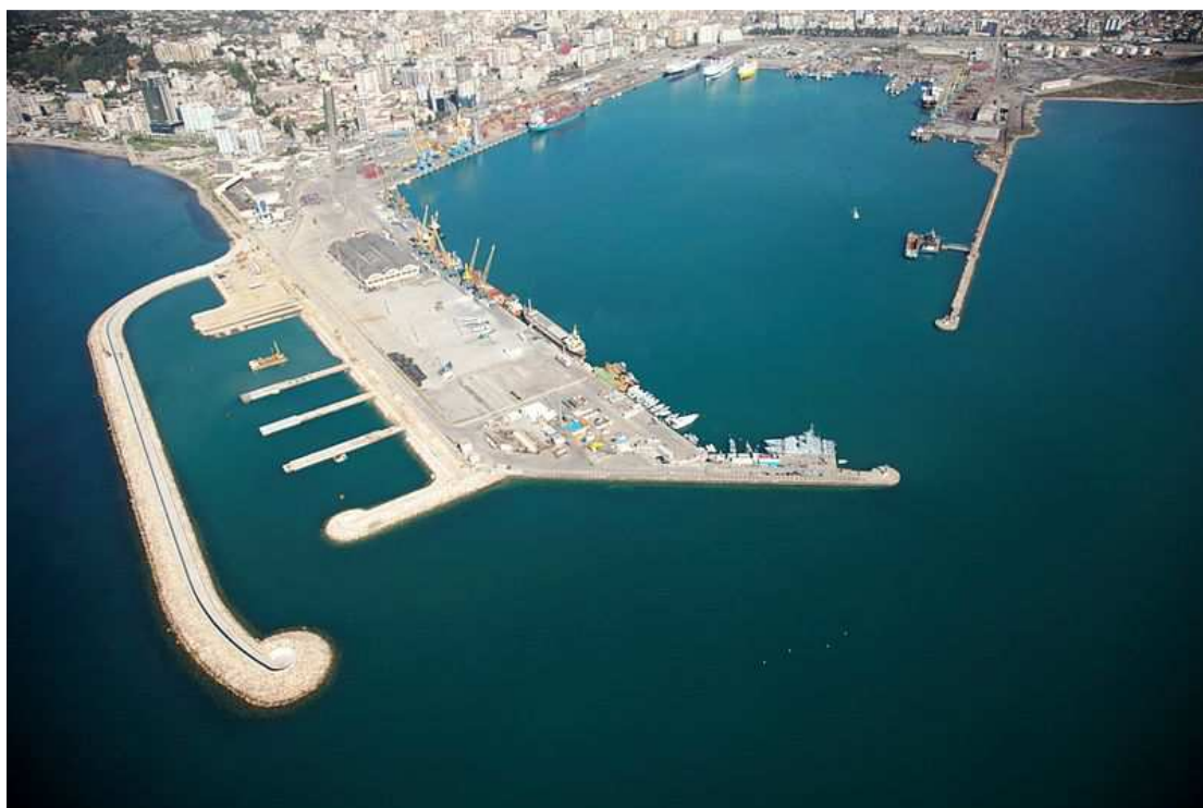
Εικόνα 1: Σημερινή όψη του λιμανιού στο Δυρράχιο 1

Μονοήμερες κρουαζιέρες διοργανώνονται από την Ιταλία, την Ελλάδα, καθώς και από άλλες ευρωπαϊκές χώρες, με βασικό προορισμό το λιμάνι των Αγίων Σαράντα, το οποίο προσεγγίζει σημαντικός αριθμός κρουαζιερόπλοιων, ενώ σημαντικός αριθμός από αυτούς τους τουρίστες επισκέπτονται τον αρχαιολογικό χώρο του Βουθρωτού. Παρόλο που υπήρχαν και υπάρχουν σημαντικά προβλήματα, στα λιμάνια της Αλβανίας η επιβατική και εμπορευματική κίνηση έχει αυξηθεί σημαντικά τα τελευταία χρόνια. (Δελλάρης, 2008)