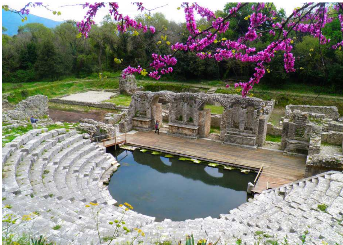
Εικόνα 3: Το αρχαίο θέατρο στο Βουθρωτό 3

Στα νεότερα χρόνια, το Βουθρωτό, το 1799 κατακτήθηκε από τον Αλή Πασά, που ήταν την περίοδο εκείνη κυβερνήτης του Τεπελενίου, ενώ παρέμενε υπό την οθωμανική διοίκηση, μέχρι την ανεξαρτησία της χώρας το 1912. Ο Αλή Πασάς, προκειμένου να προστατέψει την πόλη έχτισε φρούριο, για άμυνα προς τους Οθωμανούς αλλά και τους δεσπότες της Ηπείρου, στις εκβολές του ποταμού Βιβάρι, τμήματα του οποίου έχουν παραμείνει ακόμα και σήμερα. (EX.PO AUS, 2017)